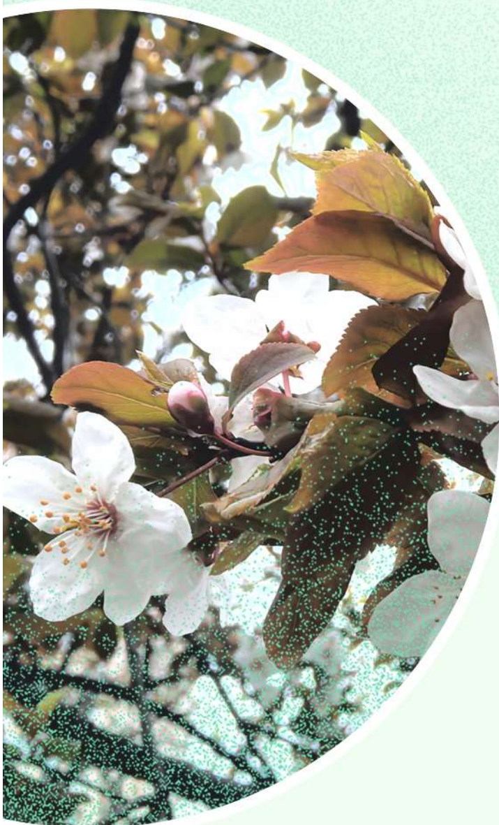
粉白的花瓣，衬着绿紫色的嫩叶，一簇簇，一层层，说不尽春日浪漫。