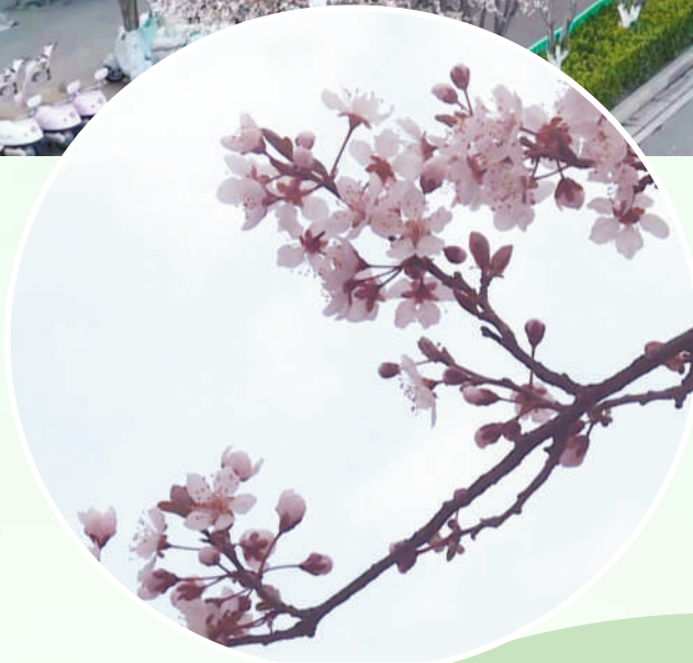
紫叶李的花语，是“幸福与希望”。