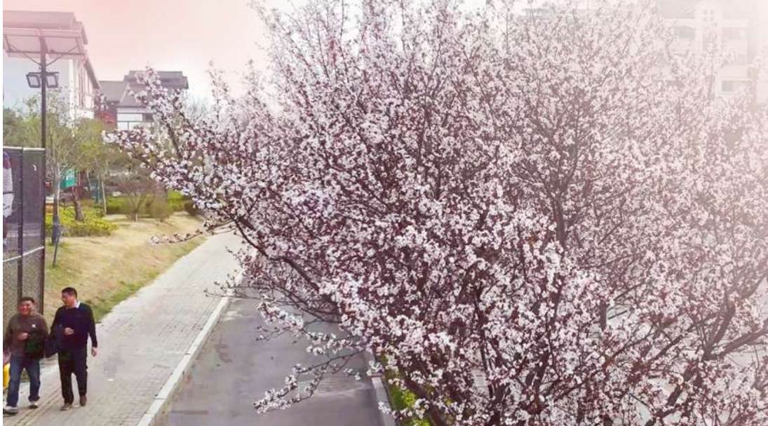
一树的繁花，开得那样满，那么美。