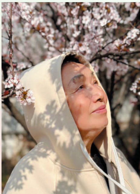
在紫叶李的芬芳里，留下春日的记忆。