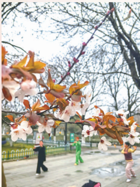
紫叶李花的陪伴，提升了晨练市民的幸福感。