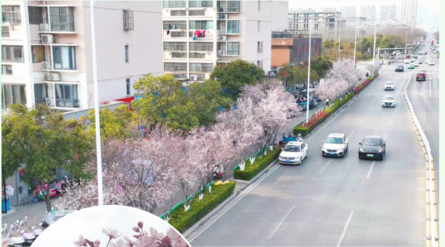
三月的浪漫，藏在盛放的紫叶李间，车随花影行，风携暗香来。