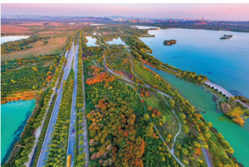
沱河路沿岸色彩正浓。