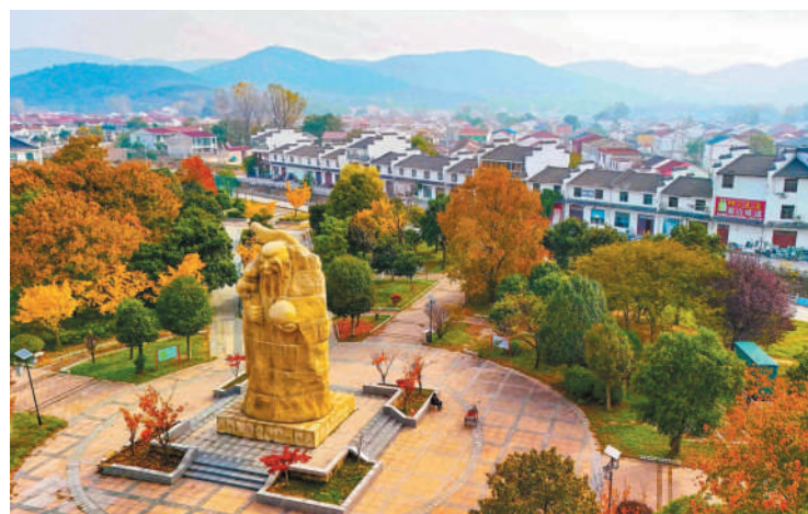
长寿南山风光秀美。