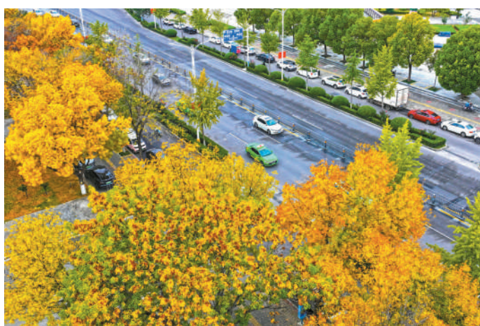
人民路街头树木“披金”。