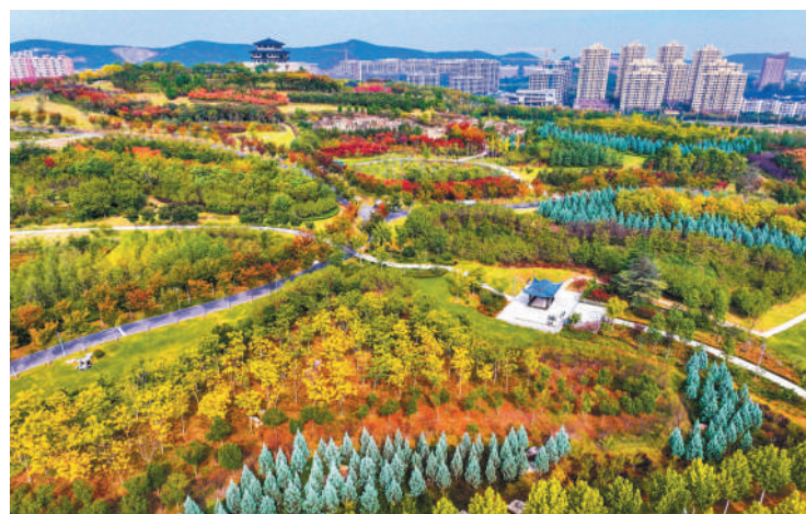
花山公园色彩斑斓。