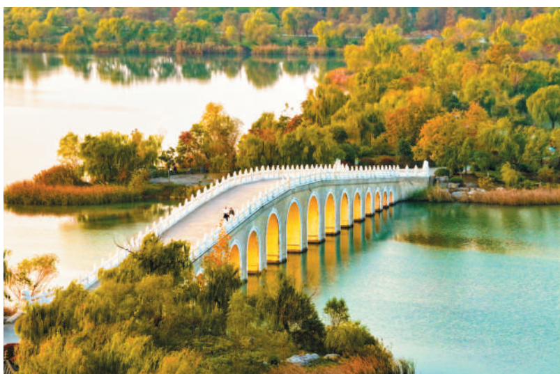
南湖湿地公园现“金光穿洞”景观。