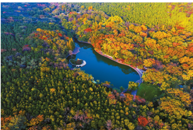
相山天池绮丽景色。