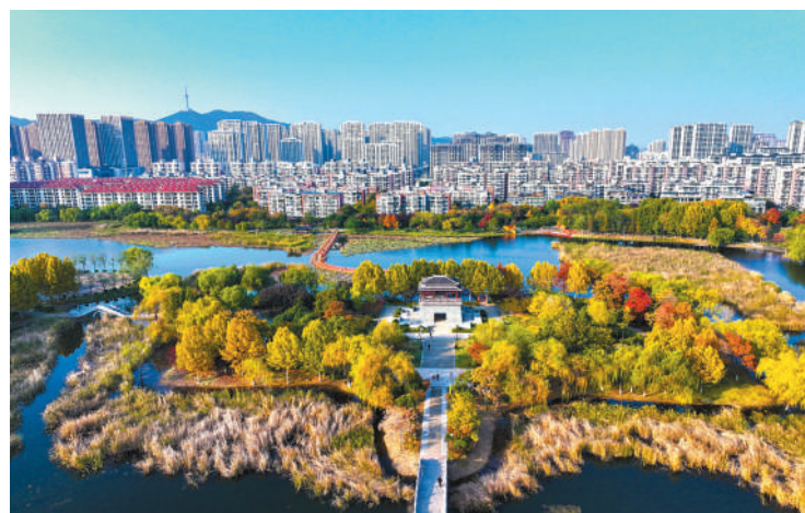
榴潭公园景色迷人。