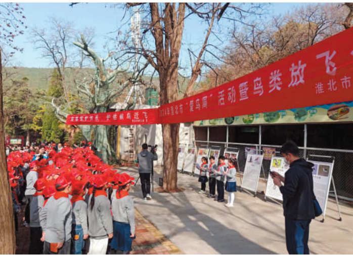
2024年爱鸟周宣传活动。