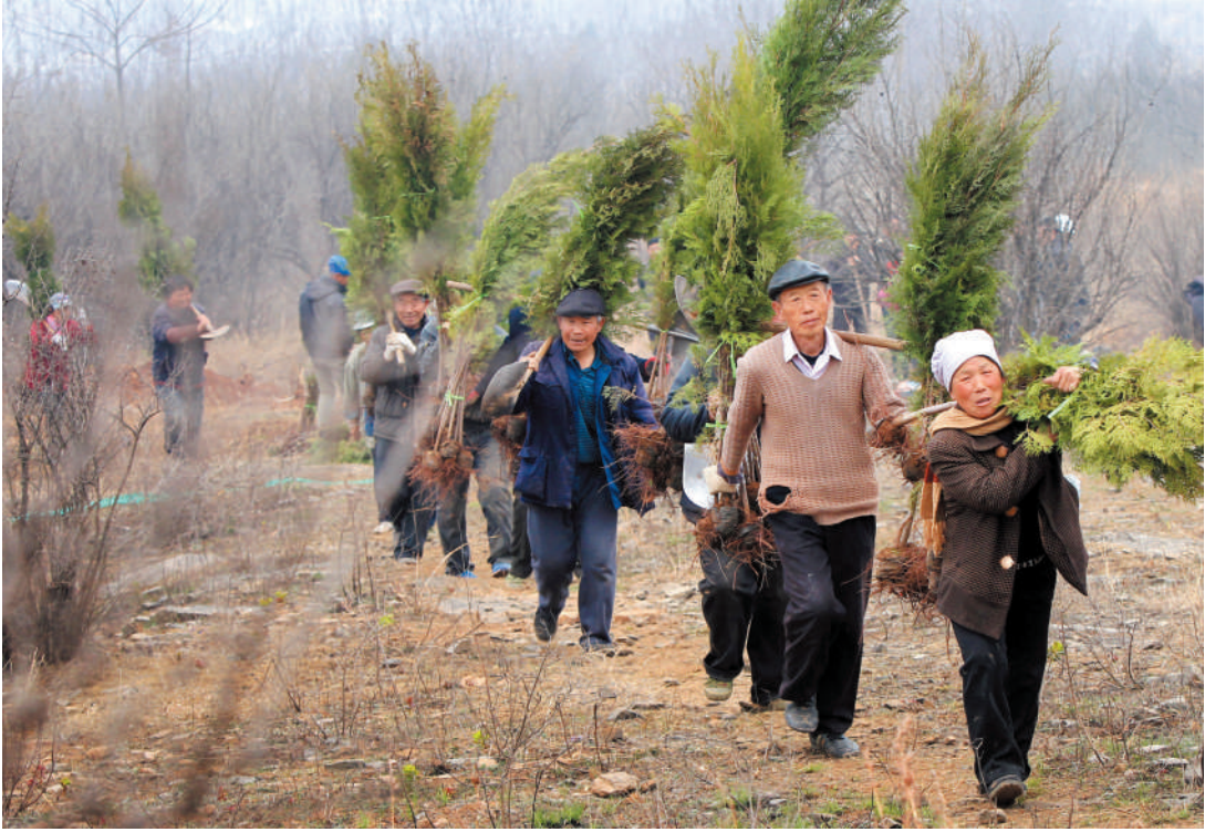
植树造林为荒山披新衣。

特别是“十四五”以来，全市林业部门深入践行“绿水青山就是金山银山”理念，以深化林长制改革为总牵引，聚焦“护绿、增绿、管绿、用绿、活绿”五大任务，锚定“上山、归田、进湿地、强产业”战略方向，科学推进国土绿化，扎实开展绿美江淮建设，大力实施“二次上山”行动，推动林业治理体系和治理能力现代化，实现了从“荒山”到“青山”，并奋力迈向“金山银山”的华美蝶变。