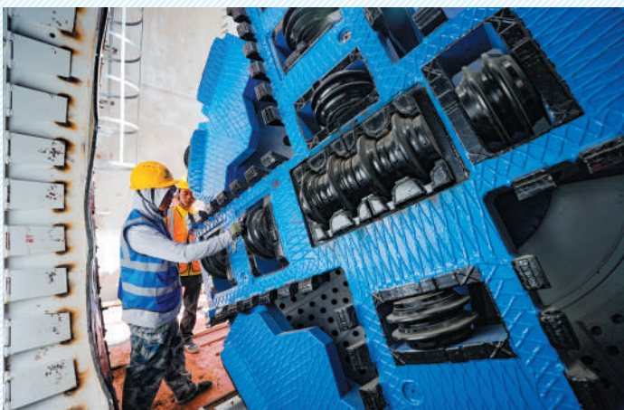
工人正在检查盾构机钻头。

化家湖水库是我市唯一一座中型水库,建于1958年。规划设计后,其总库容1690万立方米,最高蓄水位34.2米。水源地从引江济淮输水通道王引河侯王闸下取水,取水规模每秒7.3