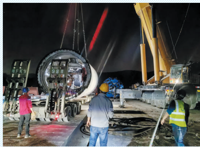
泉山隧洞盾构设备进场吊装。

立方米,新建输水管道约20千米,穿越梧桐大道、萧濉新河、符夹铁路、南外环、闸河、东外环、京台高速、塔山路等主要河道、沟渠和公路至化家湖水库。