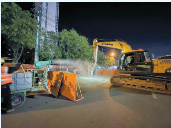
盾构机头部93T、尾部45T顺利到场。