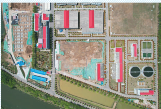
烈山水厂改造(施工)项目超滤膜车间土方开挖,化验中心及调度中心基础施工。

淮北群众喝上引调水工程建成后,将显著提升水资源调配能力,全面改善城乡居民饮用水质量,为经济社会高质量发展提供有力水务支撑。项目全线建设者坚守岗位奋战一线,全力抢进度、保节点,确保工程顺利推进。我们共同期待着年底淮北人民能够喝上更加安全、优质的饮用水,共同见证这一民生工程带来的巨大变化。