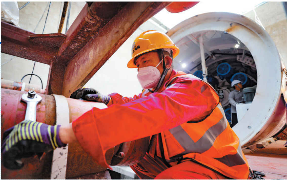
工人在现场检修保障施工进度。