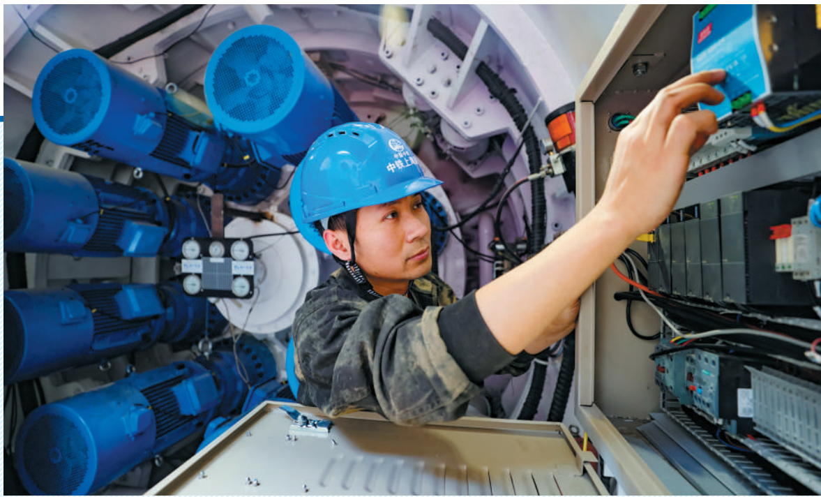
工人正在检查盾构机线路。