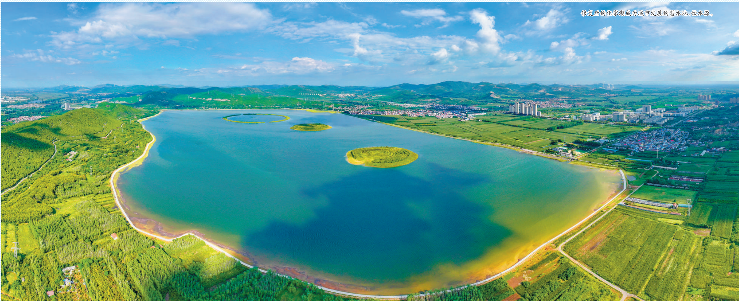
修复后的化家湖成为城市发展的蓄水池、饮用水源。