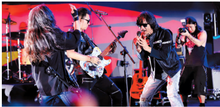
丁武(右二)在摇滚音乐夜上演出。