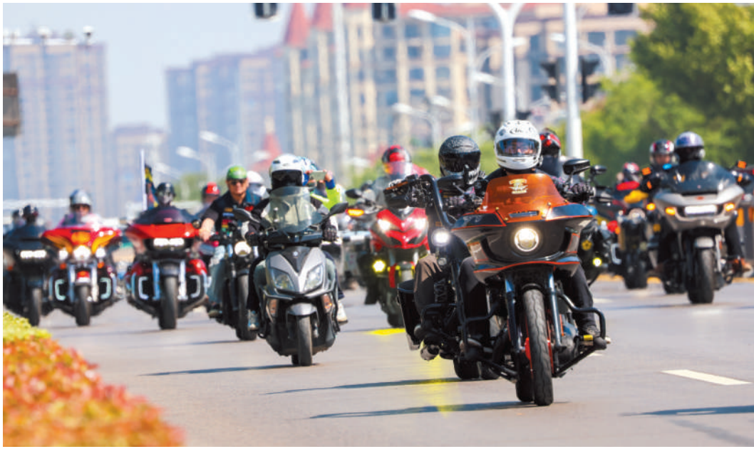
重机巡游淮北。

“好久没那么激情澎湃了”“我以后也要买一辆机车”“能近距离看唐朝演出太幸运了”,演出在激昂旋律中落幕,现场热情未减。观众们起立鼓掌,久久不愿离去。台上的灯光渐暗,欢呼与掌声却似潮水般汹涌。