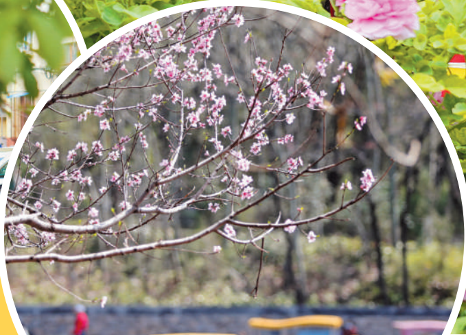
市民在相山公园里享受春光。