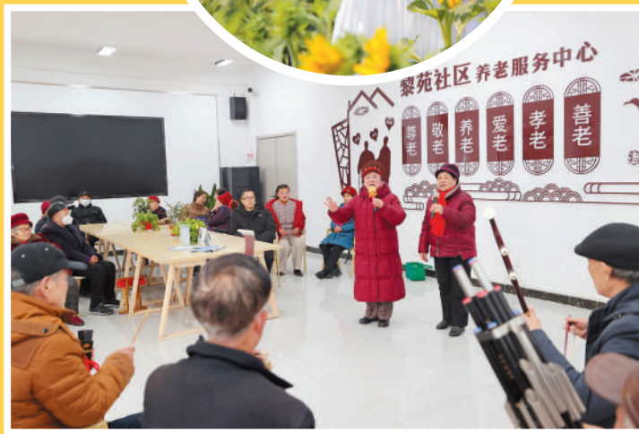
黎苑社区养老服务中心内，老人们在练习戏曲。