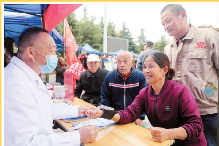
东街道铁路社区居民在东岗立交桥下广场赶公益便民“大集”。