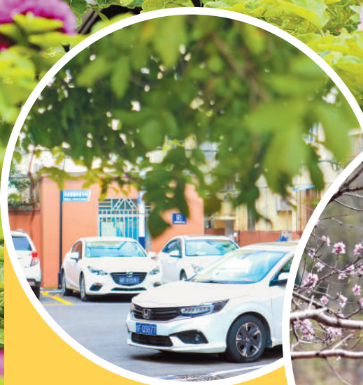
老旧小区改造惠民。