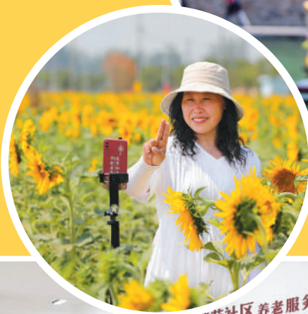
渠沟镇张楼村油菜种植基地吸引游人前来“打卡”。