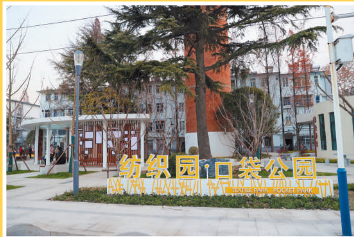
“口袋公园”提升群众幸福感。