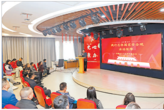
“践行国家安全观”法治讲座吸引了许多听众。