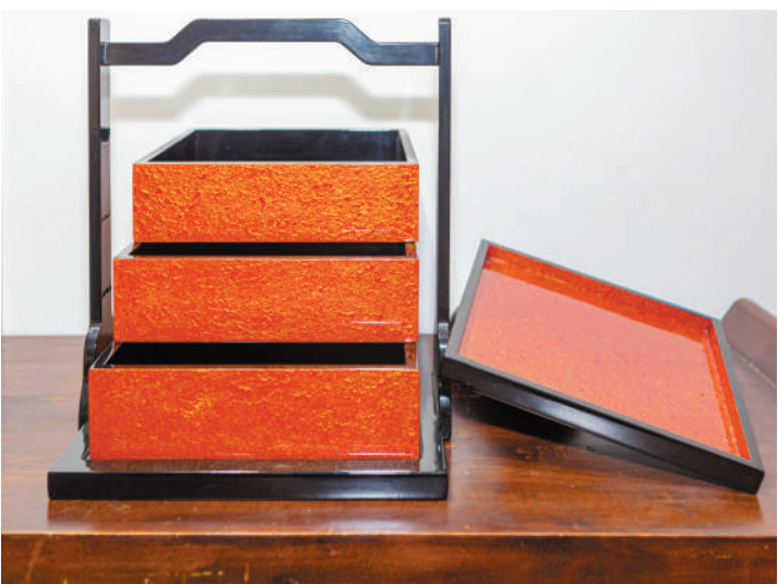
“漆”之美，岂止美。木胎红金食盒在安徽省工艺美术展上荣获金奖。