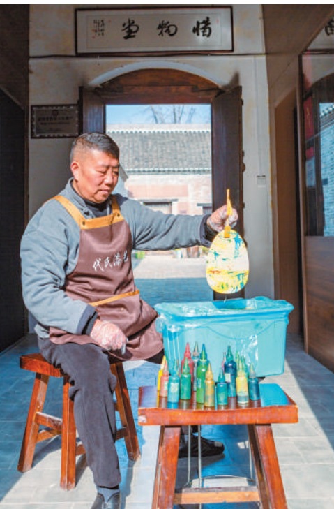
选出几种喜欢的漆料倒入水中，缓缓放入纸扇，轻搅、慢捻、旋转、翻面，一把“独一无二”的漆扇就出炉了。

在祖辈的木匠铺待了四百个日夜后，他开始研习装饰技法，堆漆就是这期间跟着祖辈学到的手艺。黑漆大瓶上堆出片片花瓣，轮廓分明。一层大漆厚度薄如发丝，无数次堆积方可显浮雕之效。