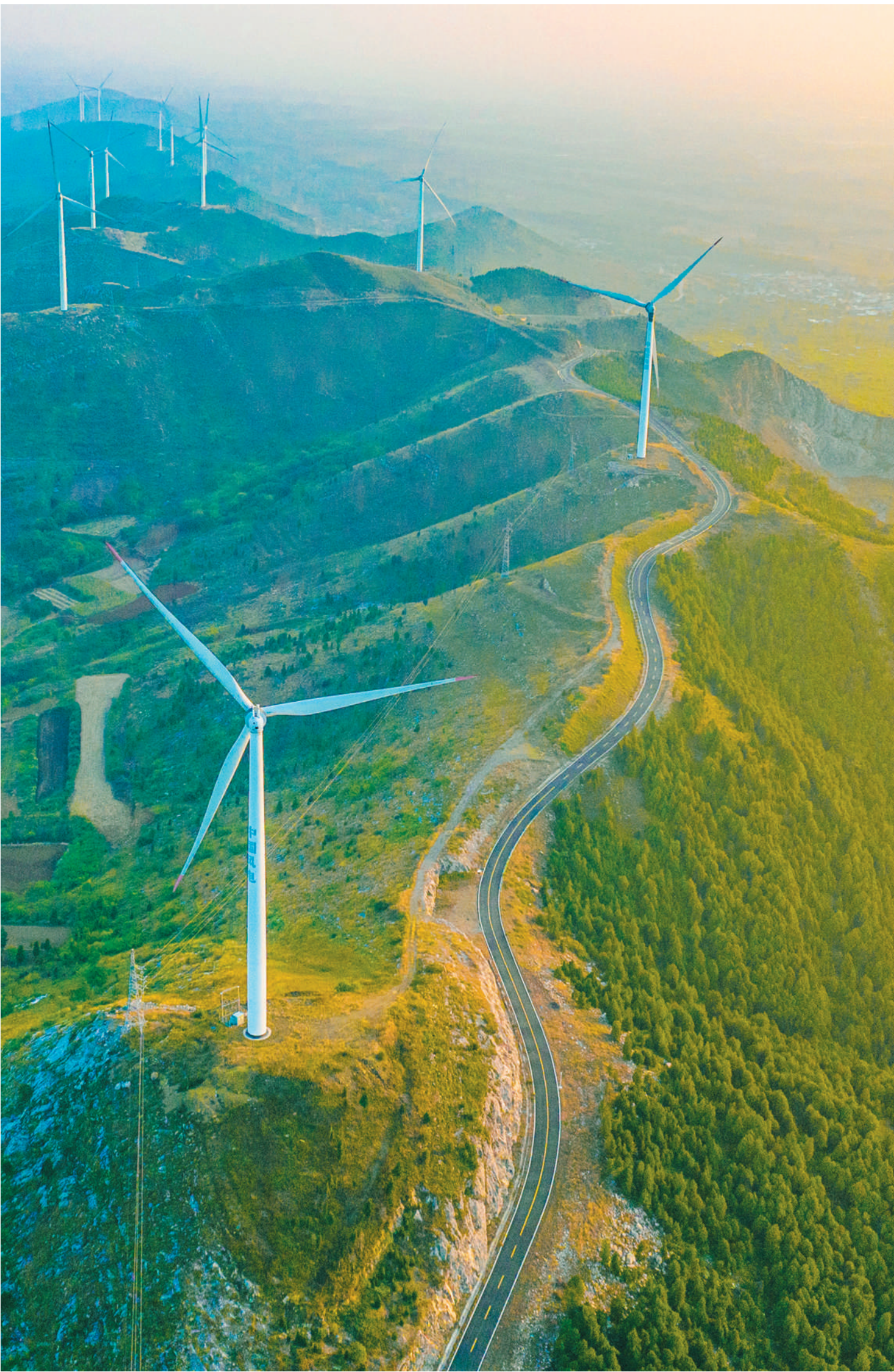
“龙脊天路”蜿蜒于山岭间，犹如巨龙盘旋，气势磅礴。