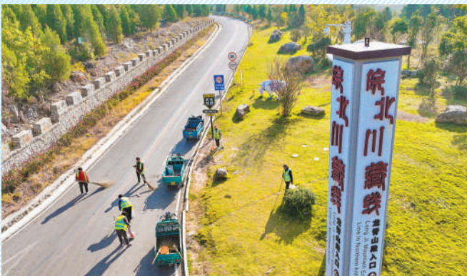
榴园村村民实现了家门口就业。