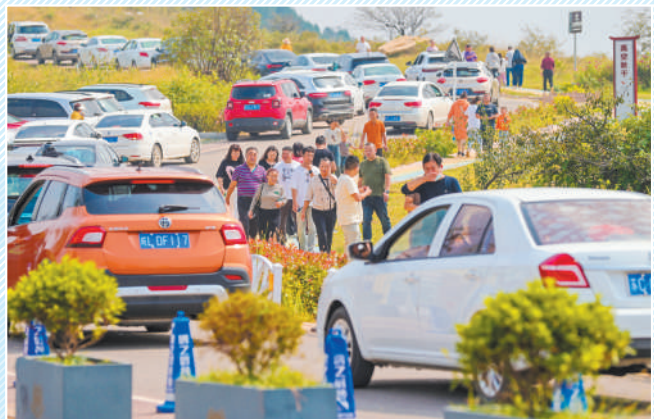
“龙脊天路”成为远近闻名的网红景点。