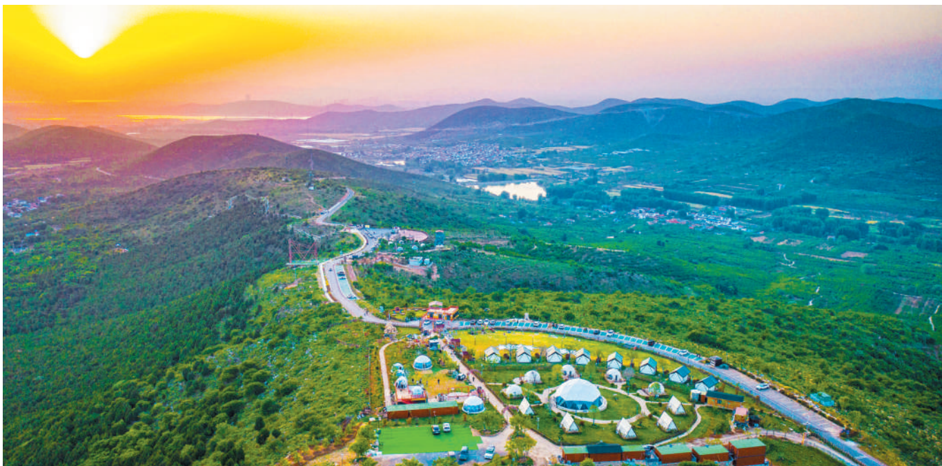
“龙脊天路”绘就农文旅融合发展的“诗和远方”。