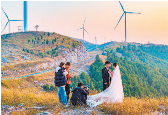
一对新人在“龙脊天路”定格幸福时刻。