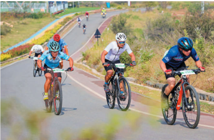
2023长三角自行车联赛参赛选手在“龙脊天路”赛道上角逐。