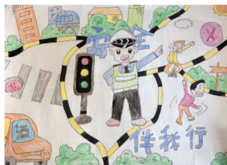
淮海路小学小记者 范孜雯 指导老师:李洁文