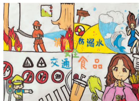
淮海路小学小记者 刘瑾萱 指导老师:代素梅