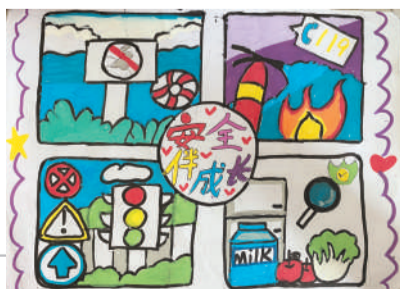
淮海路小学小记者 李彦萱 指导老师:李洁文