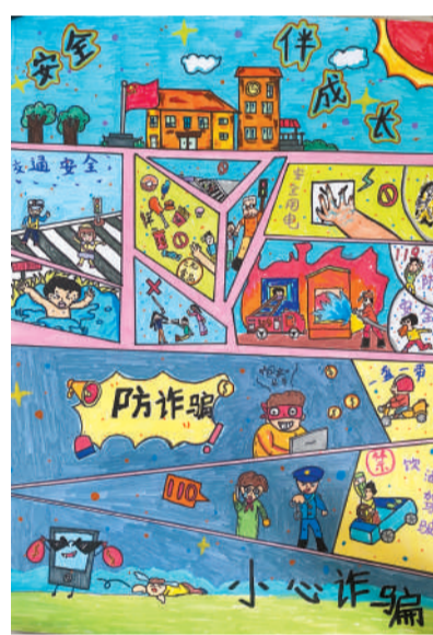
淮海路小学 任乾坤 指导老师:李洁文