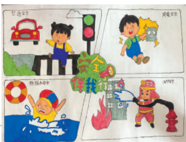
淮海路小学小记者 谭雅娜 指导老师:李洁文