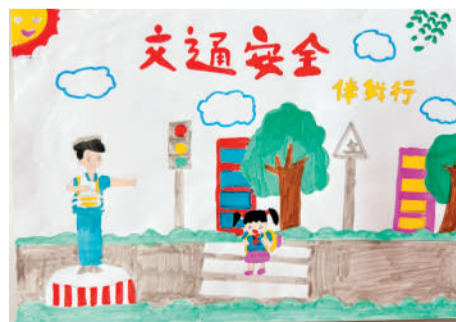
淮海路小学小记者 魏子萱 指导老师:代素梅