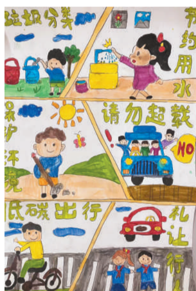
淮海路小学小记者 蔡沐辰 指导老师:代素梅