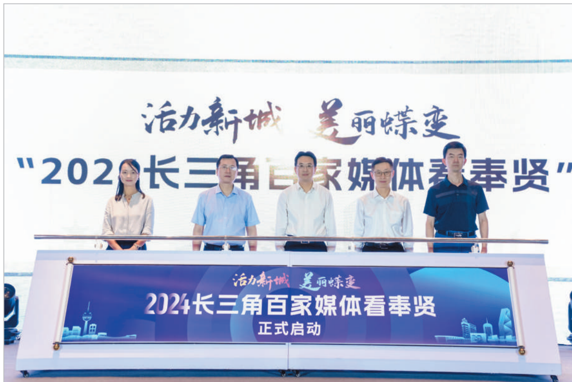
与会嘉宾共同启动长三角百家媒体看奉贤活动。