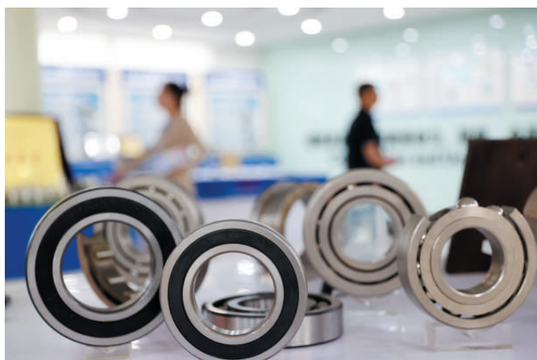
上海人本集团可生产内径1毫米至外径6米范围内各类轴承30000余种。