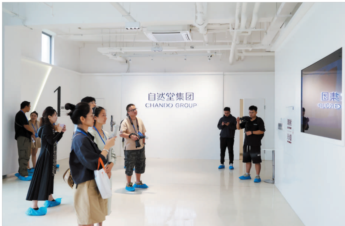
长三角百家媒体记者在上海自然堂集团采访。