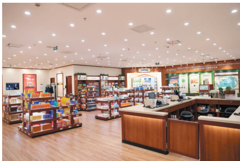
美乐家(中国)日用品有限公司上市近400款产品,满足消费者多方面的购物需求。