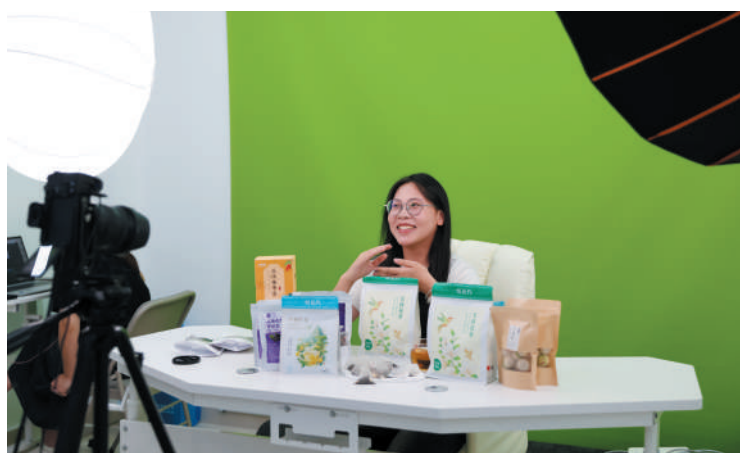
全国首个有影响力且有官方认证的电商直播产业创新发展示范点落户四团镇五四村。

光阴荏苒,长三角百家媒体看奉贤活动今年已经是第四届了,每年主办方会邀请长三角百家主流媒体记者,分多条线路进城区、下乡村、品成果、看发展,全面总结展示奉贤区转型发展的成果经验,描摹“绿色生态、实力强劲、人民幸福”的奉贤新城新面貌,全景式传播展示奉贤的产业之“特”、新城之“新”和城市之“美”。