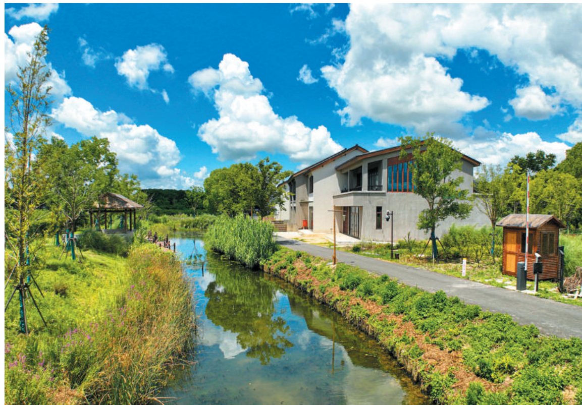
庄行郊野公园——桃花鹿鹿风景宜人。

2023年11月24日,“爱直播 爱奉贤”上海抖音&抖音电商“直播产业创新发展示范点”启动仪式暨奉