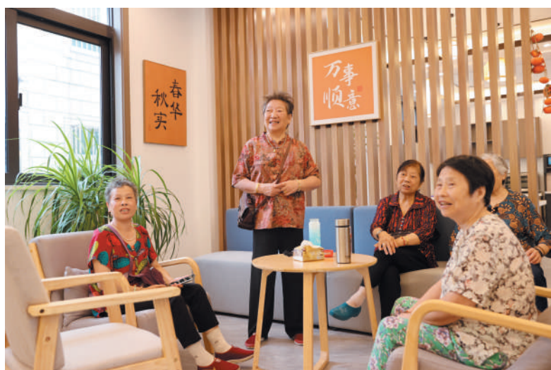
头桥街道新建成的综合为老服务中心为高龄人群提供丰富的文化娱乐活动。