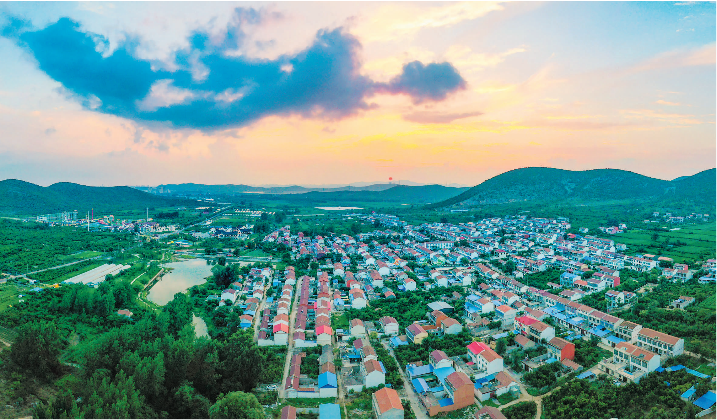
美丽乡村，宜居宜游。

风景变“钱景”。2023年四季榴园景区共接待游客180万人次，实现营业收入770余万元，带动周边餐饮零售3000万元，为300名群众提供“家门口”就业机会。今年“五一”期间，四季榴园景区共接待游客23.5万人次，同比增长18.7%，不佳景区管理公司收入达190余万元，带动周边群众售卖农特产品和经营餐饮行业等营收480余万元。凭借着深厚的人文底蕴、丰富的自然资源和广阔的市场前景，烈山区农文旅融合实现更广范围、更深层次、更高水平的融合发展，持续释放出乡村振兴的新活力。“下一步，烈山区将持续深挖文旅资源，延长文旅产业链条，积极发挥政府职能，加强项目建设，加大招商引资力度，加强宣传推广，不断提升烈山旅游的知名度和美誉度。”烈山区文旅体局负责同志在接受记者采访时说。