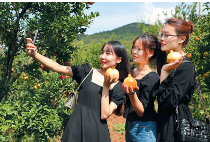
石榴文化旅游节留影。