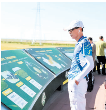
与会人员参观苜蓿草种植基地。

以盛会为媒，活动期间多位媒体“大咖”走进内蒙古和林格尔新区中国云谷、蒙牛、盛健羊乳、呼和浩特雕塑艺术馆、恼包村和敕勒川国家草原自然公园等地，以手中的镜头与文字全面展现呼和浩特高质量发展的新进展、新成效、新风貌，讲述一城精彩，描绘一城风华。