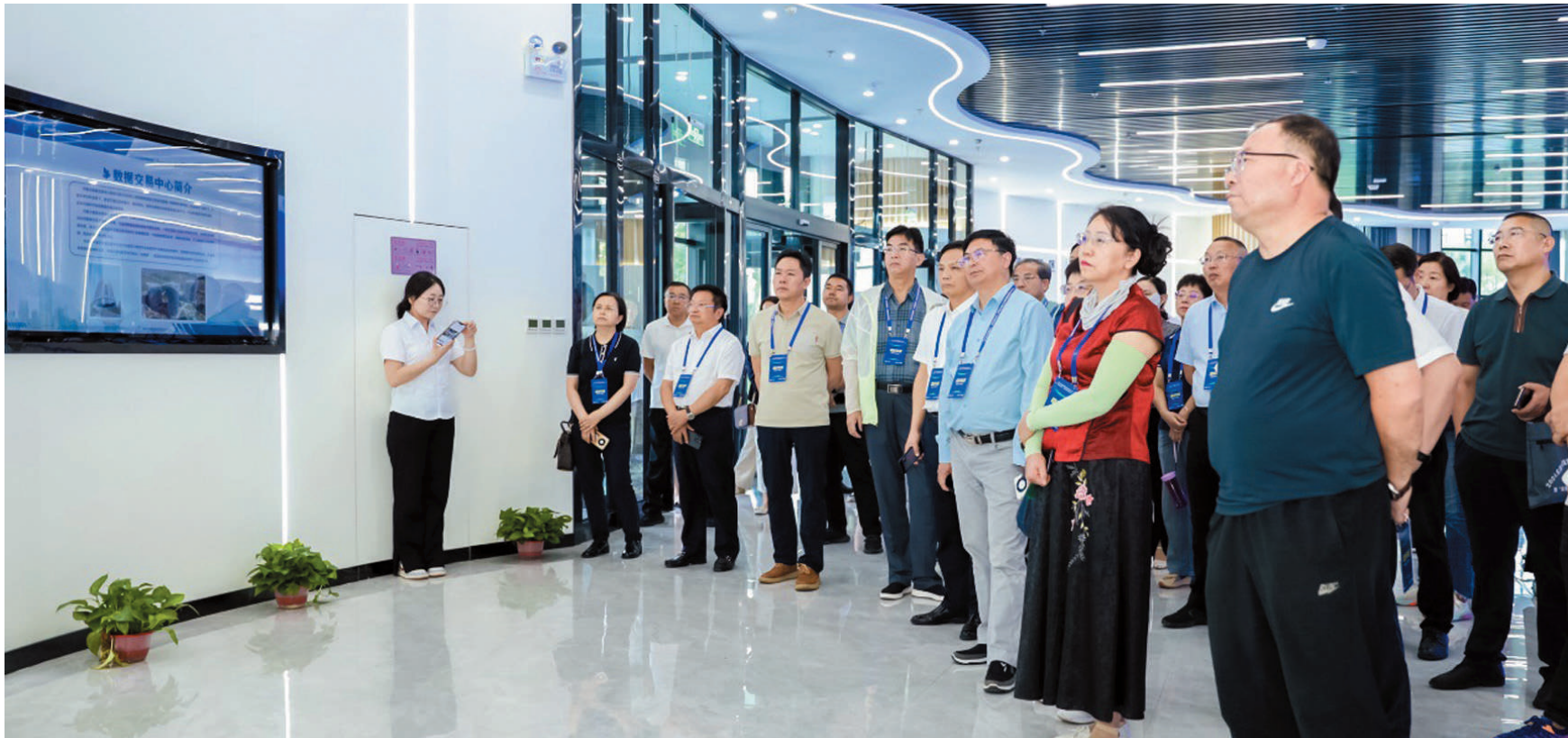
与会人员参观内蒙古数据交易中心。