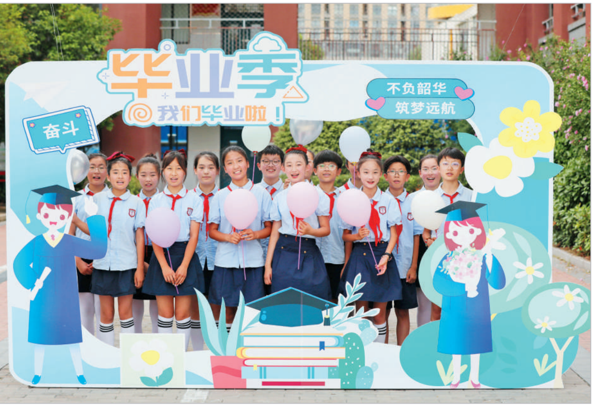
7月7日,市泉山路学校为六年级学生精心准备了一场毕业典礼,为即将步入初中生活的同学们送上真挚的祝福。