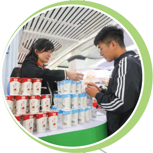
依托食博会平台，推动产业跨越式发展。