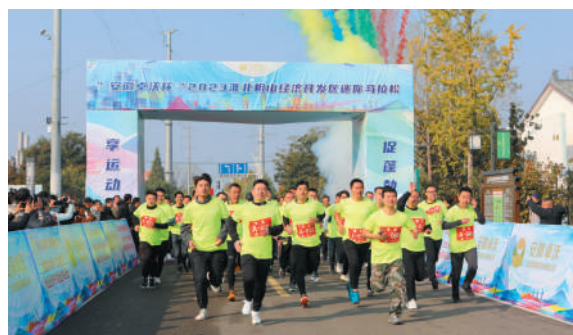
“安徽卓沃杯”2023淮北相山经济开发区迷你马拉松开赛。