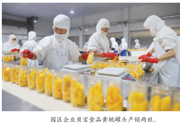
园区企业贝宝食品黄桃罐头产销两旺。

献。一年来，相山开发区坚持规划引领，统筹谋划布局。坚持以食品制造(生物科技)、信息技术产业为主导，其他产业辅助并行，推动产业集聚发展。积极推动成片开发方案编制工作。结合成片开发方案，谋