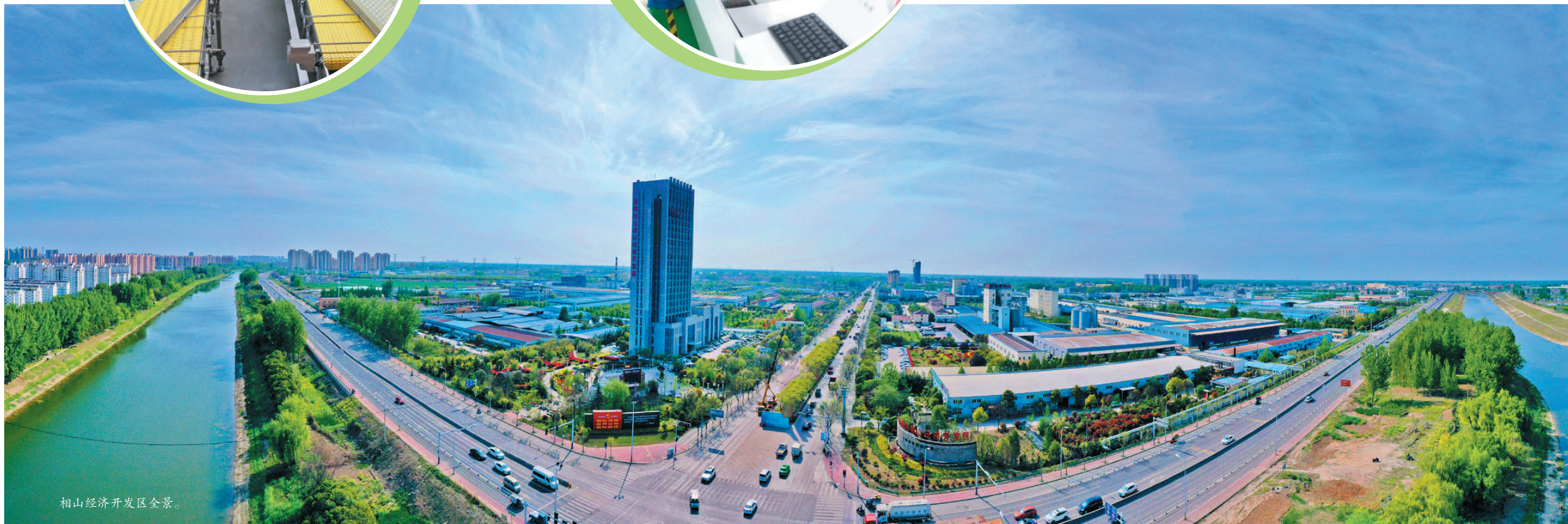
相山经济开发区全景。