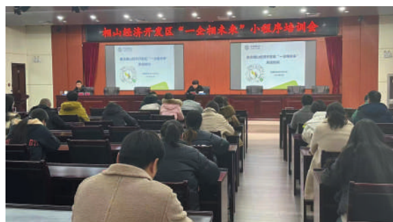
园区开展“一企相未来”小程序培训会。

一年来，相山开发区坚持改革驱动，凝聚发展活力。加速推进“管委会+公司”改革，成立相山工业投资集团，完成营业收入1730.61万元。建立园区专项基金，完成省新能源汽车和智能网联汽车产业子基金组建工作，出资参与全省绿色食品产业(暨安徽省乡村振兴)主题母基金组建并完成第一笔1000万元注资。发挥“亩均论英雄”改革牵引作用，分类推动低效工业用地企业处置，盘活低效工业用地18家，处置土地560.57亩。推深做实“标准地”改革，全年出让5宗地块，约181亩。全面推进开发区体制改革，完善开发区队伍和内部运行机制，深化全员聘用、竞聘上岗制度，变“要我干”为“我要干”，有效激发干事创业的内生动力，为园区产业动能提升持续激发澎湃动能。