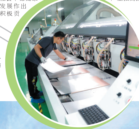
园区企业普浩集成电路创新引领发展。

划建设“建材产业园”“绿色食品产业园”“冷链物流园”“快递物流园”，合理配置园区空间和产业布局，发展潜力充分释放。一年来，相山开发区坚持招商为先，推动项目对接。完善招商机制，突出抓好招商项目洽谈、落户、竣工、投产、达产“全过程”闭环服务。制定招商引资工作标准流程，聚焦食品制造(生物技术)、信息技术两大主导产业，编制主导产业招商图