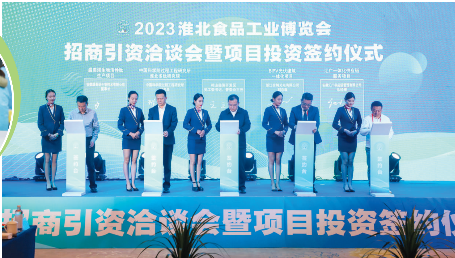
2023淮北食博会招商引资洽谈会暨项目投资签约仪式。