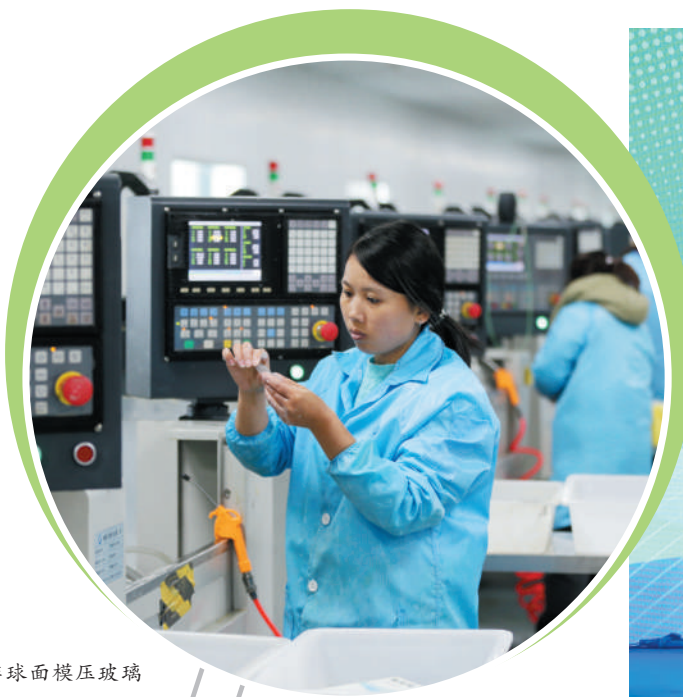
龙麒纳米科技非球面模压玻璃镜片项目生产一线。