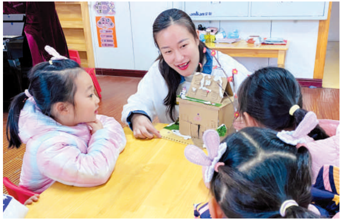
指导幼儿手工活动。