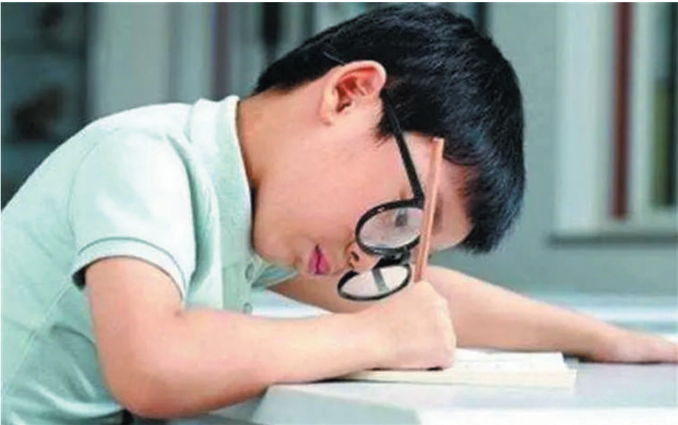
小朋友，要学会爱护眼睛哦。