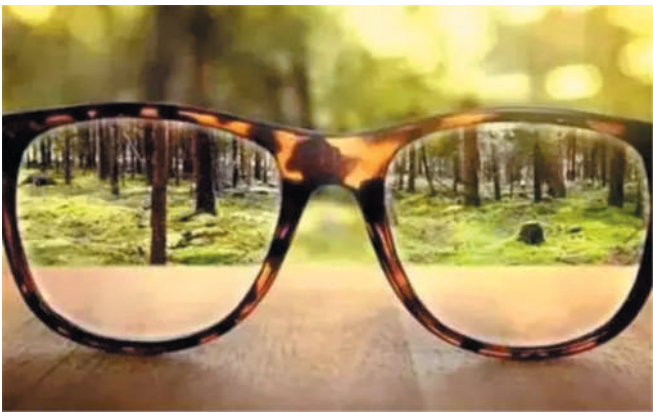
爱护眼睛，远离眼镜。