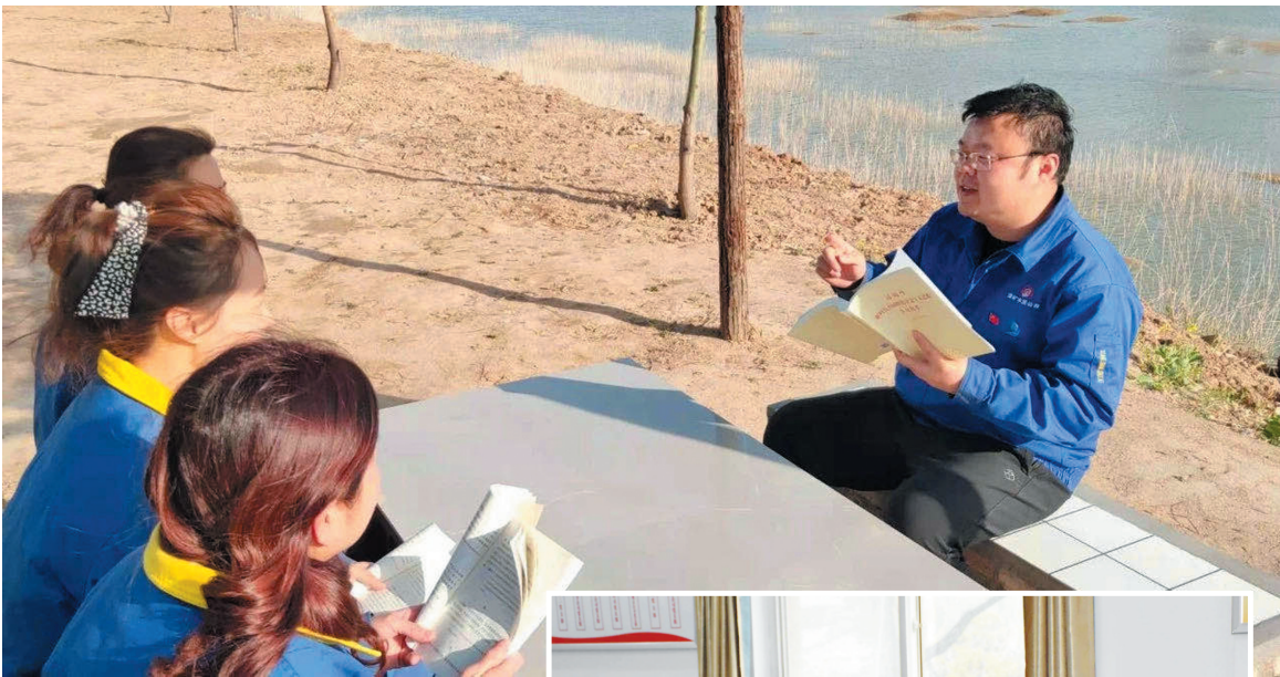
相山水泥公司开展党史学习教育“微宣讲”。

该集团党委成立党史学习教育领导小组和办公室，明确领导小组工作职责，压实具体责任。同时，24家基层单位党组织也成立相应领导机构和工作机构，确保了学习教育组织、人员、工作、责任落实到位。3月5日下午，集团公司党委召开“学党史、抓整改、正作风”动员会，对党史学习教育进行专题部署。基层单位迅速行动，层层传达，确保工作安排到底到位。按照中央、省委及省国资委党委工作部署，印发开展党史学习教育实施方案、工作方案，明确了三个重要时间节点（党中央召开党史学习教育动员大会到“七一”庆祝大会，“七一”庆祝大会到党的十九届六中全会、党的十九届六中全会到总结大会）和五项重点任务（开展专题学习、加强政治引领、组织专题培训、开展“我为群众办实事”实践活动、召开专题组织生活会和民主生活），为深入推进党史学习教育划出了路线图、列出了时间表、压实了责任制。