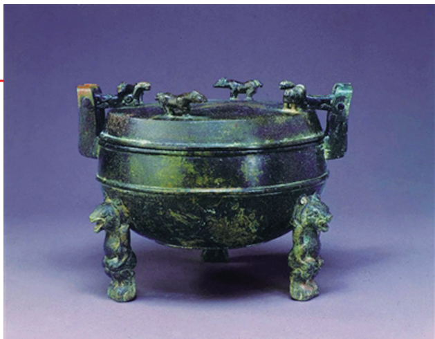
熊足铜鼎。