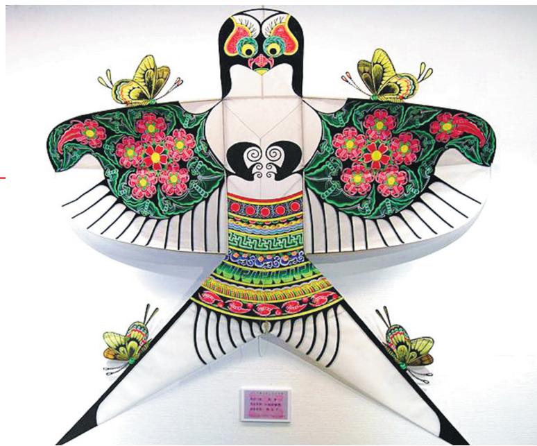
沙燕风筝中的“肥燕”。