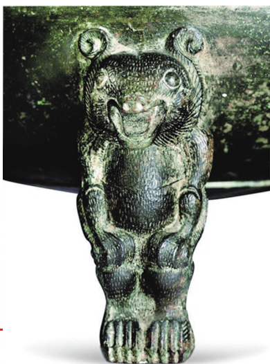
鼎的三足为蹲立状的小熊。