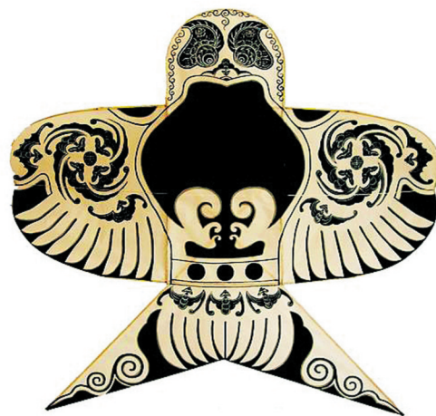
沙燕风筝中的“雏燕”。