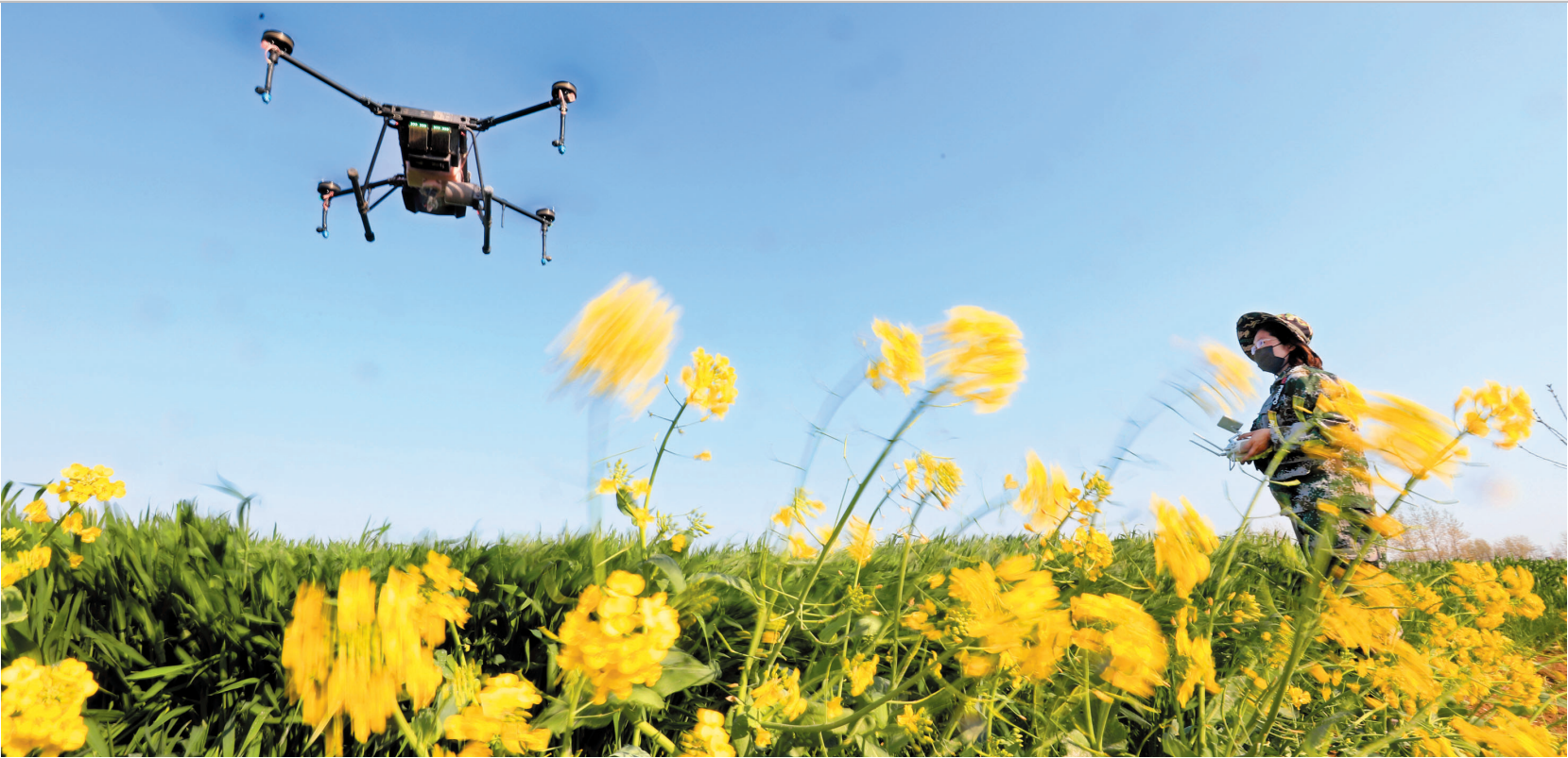
4月12日，濉溪县双堆集镇槽坊村村民利用无人植保飞机为麦田喷施药肥，防治小麦病虫害。当前正是小麦拔孕穗期，更是小麦病虫害防治的关键时期，该镇抢抓时机，积极组织群众做好小麦“一喷三防”综合防治工作，要求镇农林技术服务站密切监测小麦病虫害发生动态，明确防治责任，落实防治任务，把小麦病虫害消灭在萌芽状态；通过大喇叭、宣传车、发放宣传单等形式，向群众宣传小麦病虫害防控技术；要求农技人员深入田间地头，根据小麦不同田块的不同病虫害特征，指导农户选择不同的施药品种和施药时间，做到科学防控，全面夯实今年小麦丰收基础。

新技术、新项目的开展，一直以来都是医院持续高质量发展的基石，也是医疗机构学科建设、医疗服务等核心竞争力的直接体现。近年来，濉溪县中医医院把提高医疗质量和服务水平作为医院快速发展的核心动力，不断拓展新领域、新技术、新项目建设领域，医疗技术水平接连实现新突破。