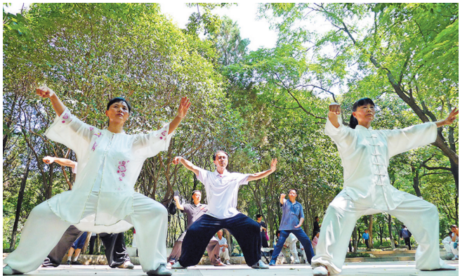
相山公园：城市绿肺成天然氧吧。