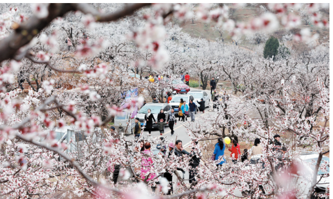
黄里杏花旅游文化节。