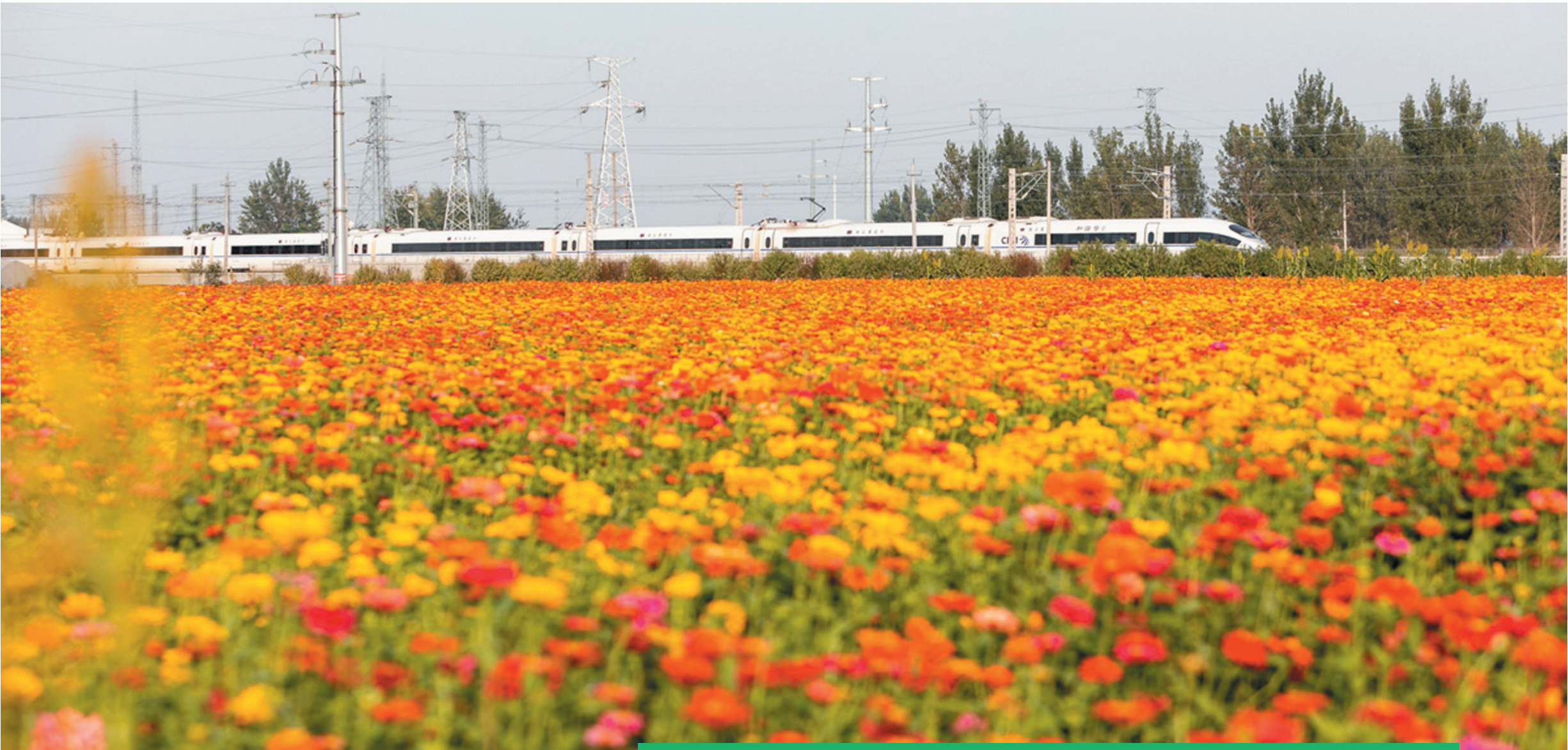
朔西湖花海秋色惹人醉。