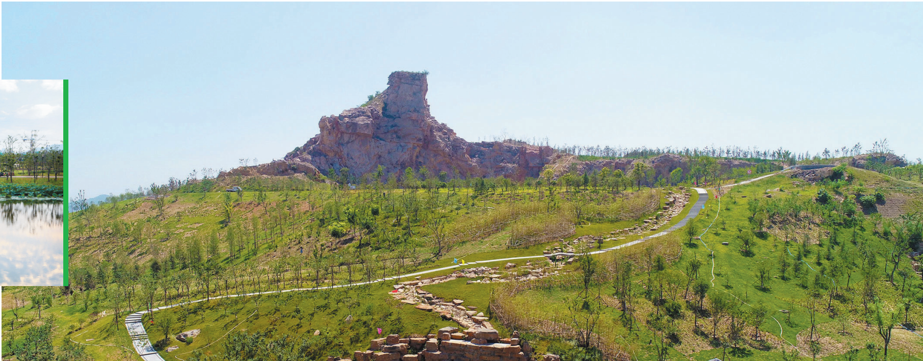
烈山区“石头山”重披绿衣。