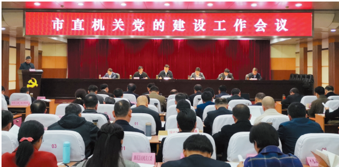
全市机关党的建设工作会议召开。