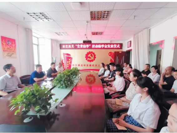
市直机关工委开展党费助学活动,贫困大学生得到资助。

栉风沐雨又一载,砥砺前行谱新篇。新的一年,市直机关工委将团结带领各级党组织和广大党员干部全面落实新时代党的建设总要求,不忘初心、牢记使命,砥砺前行、奋发有为,持续打造让市委放心,让人民满意的模范机关,为加快淮北高质量转型崛起再立新功。