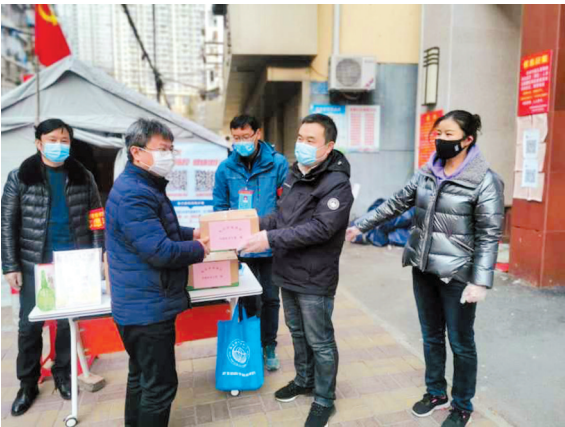
市直机关工委慰问抗疫一线党员志愿者。