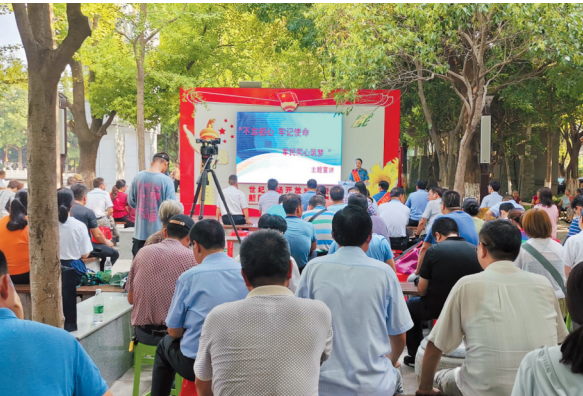
市直机关开放式党课。