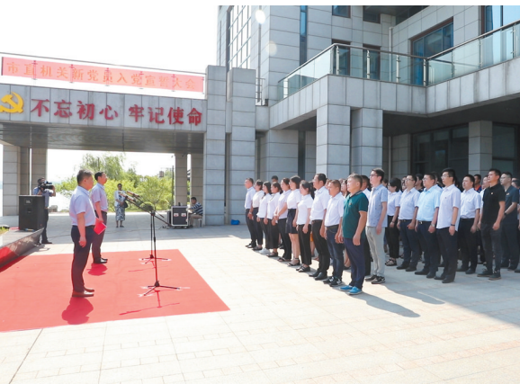
市直机关工委组织“七一”新党员宣誓活动。