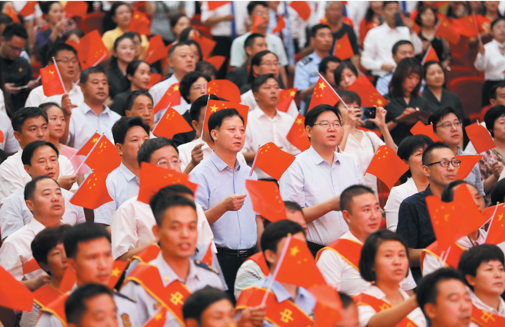
市直机关工委庆祝新中国成立70周年歌咏大会,我市干部群众用歌声表达对祖国的无限热爱和深深祝福。