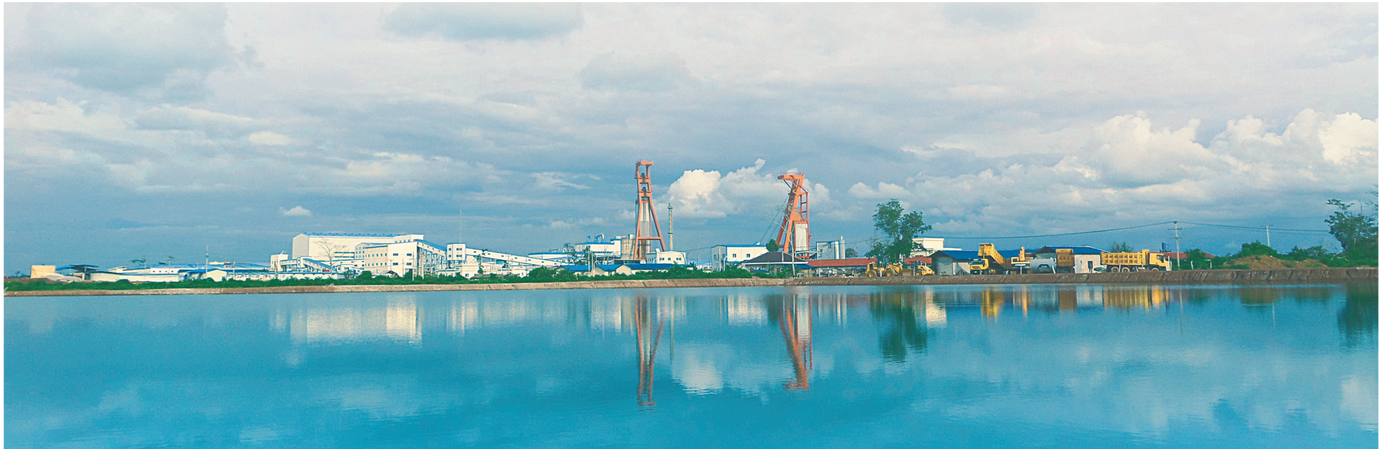
集团施工的老挝开元钾盐矿项目。