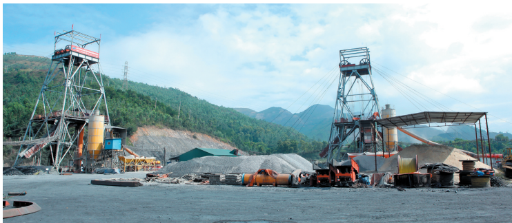
集团施工的越南溪溪煤矿工程。