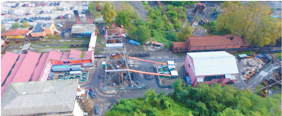
集团施工的土耳其卡拉洞煤矿工程。

为此,中煤矿建借助“一带一路”建设,制定了“攻南顾北”的开发战略,以海外市场开发部为依托,不断加大开拓力度,布局深挖海外重点目标市场。