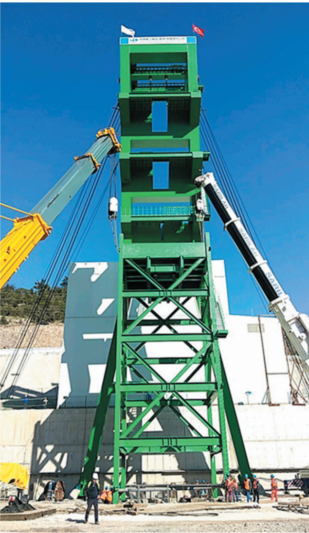
集团吊装的土耳其波利亚克煤矿井架。