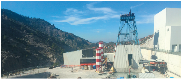
集团施工的土耳其波利亚克煤矿工程。

征程万里风正劲,重任千钧再奋蹄。在全面建成小康社会之年,中煤矿建集团海外业务发展的目标战略愈加清晰,各项工作也愈加明确,创新发展、转型升级是形势的要求、战略的抉择,更是全体海外员工义不容辞的历史责任。这艰巨的任务、光荣的使命必将推动全体海外员工励精图治,勇于创新,奋力拼搏,真抓实干,为确保中煤矿建海外事业继续破浪远航提供源源不断的澎湃动力。