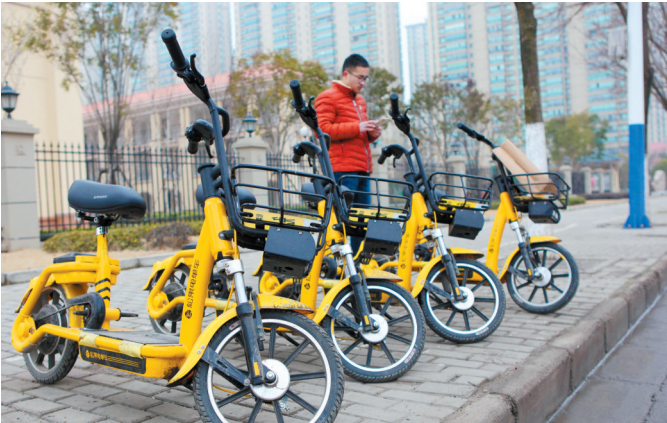
600辆“共享单车”登陆濉溪。