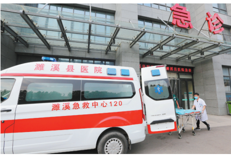
濉溪县120急救中心24小时守护人民生命安全。