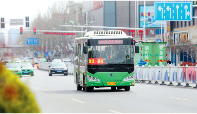
濉溪新能源惠民公交实现镇镇通。