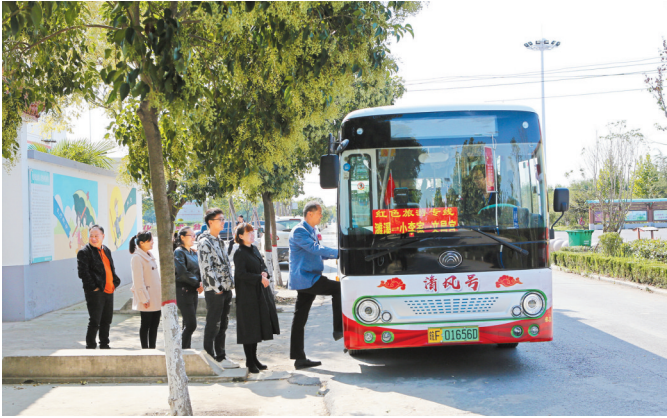
小李家红色旅游专线方便游人。

一路一景,路生美景。如今,四通八达的农村公路犹如一道道特色鲜明“经济走廊”,让濉溪的农村更强、农民更富、环境更美。“我们将认真贯彻落实中央、省委、市委关于‘四好农村路’建设的决策部署,进一步加强监督检查、加强示范引领、加强安全隐患排查,保质保量完成省交通运输厅下达的各项目标任务,为全县高质量发展提供有力的交通保障。”濉溪县交通运输局局长王廷友表示。