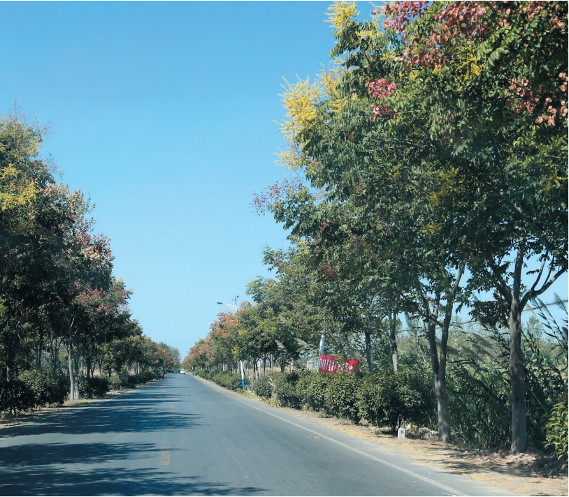
双堆集镇“四好”农村路。

濉溪县东临宿州,南接蒙城、怀远,西连涡阳,西北与河南永城接壤,总面积1987平方千米,下辖11个镇和两个园区,呈现出东西短、南北长的城市布局。最南端的行政村到县城距离93公里,开车至少得一个钟头。长期