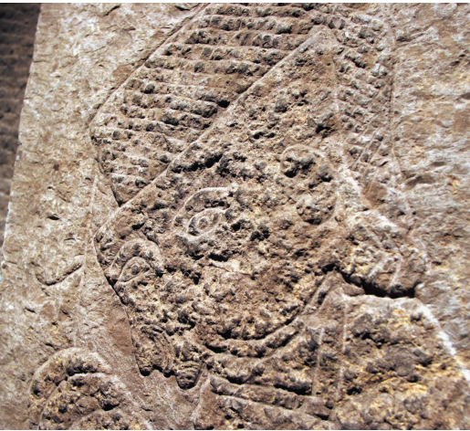
立体主义汉画像石。 ■ 摄影 记者 高墨翰