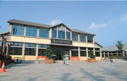
南山汉文化博物馆外貌