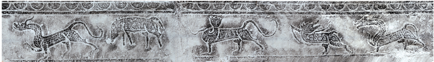
岳集汉墓出土的画像石

汉画像石在中国艺术史上具有承前启后的重要地位,它通过一幅幅生动的画面形象地再现了汉代政治、经济、军事、文化艺术与社会生活等各个方面,是两汉文化乃至中华文明最生动的图像见证。淮北市是汉画像石主要分布地区之一,汉画像石则是淮北“汉文化”的一个典型标志。