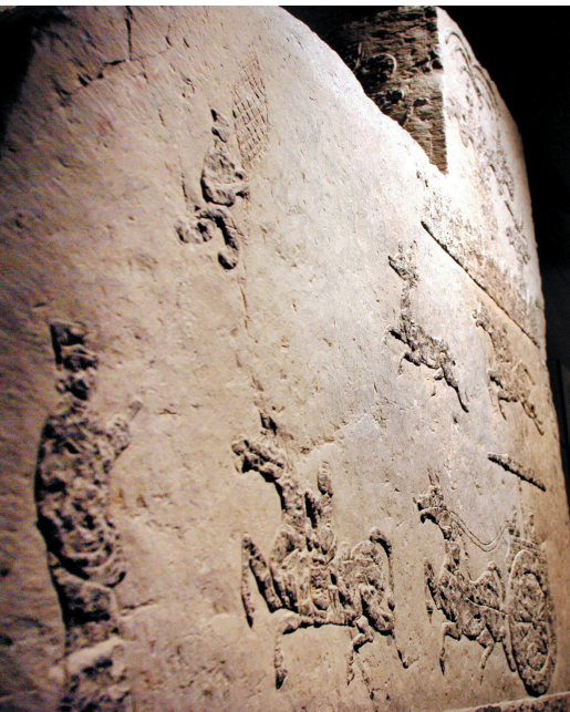
汉画像石