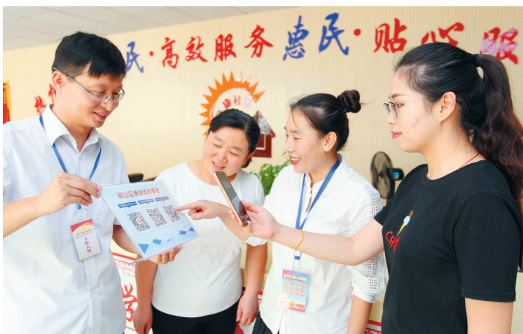
网上服务,居民享便利。