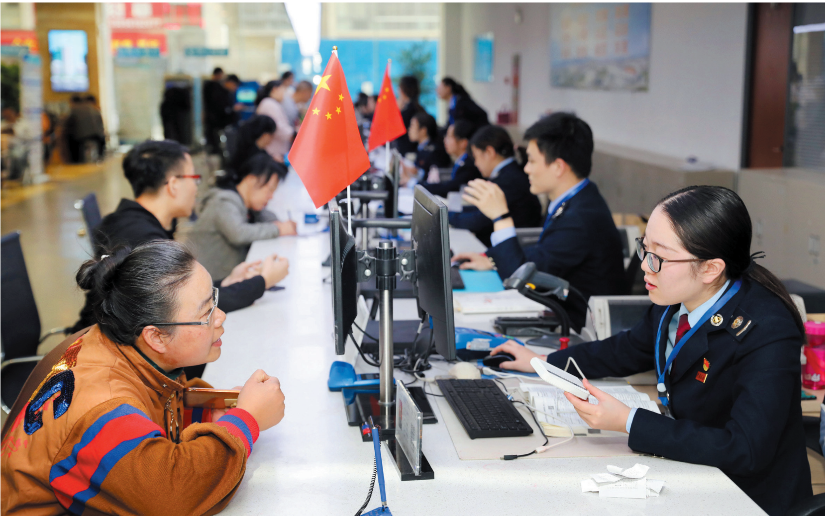
市政务服务中心提升服务质量。