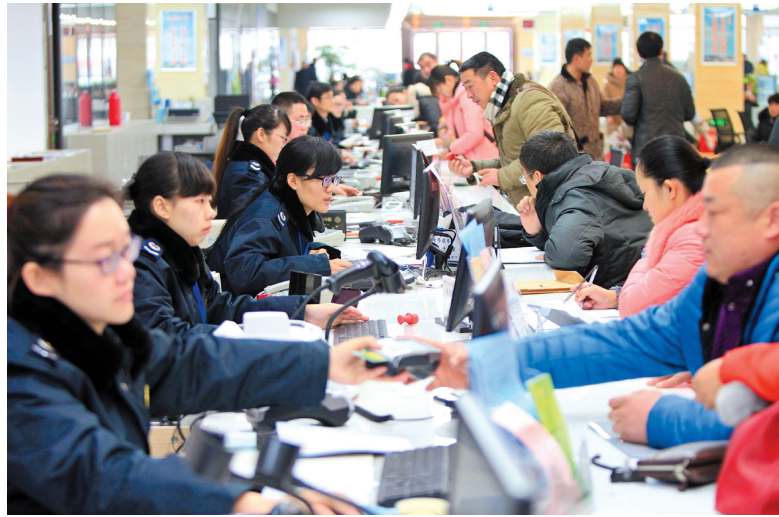
打造精品政务服务中心。