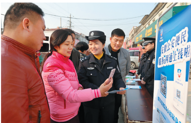
公安便民服务让数据多跑路。