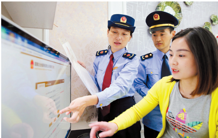
南黎市场监督管理所网上服务商户。