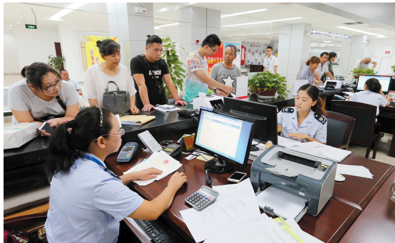
金融系统推出“一窗一人一机双系统”便民办税新模式。