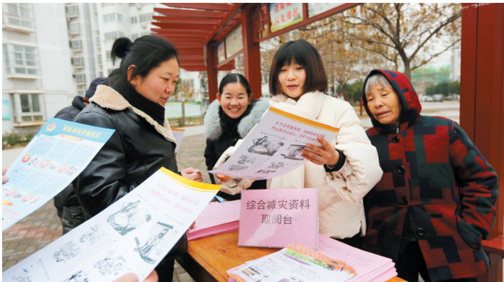
相山区滨河社区“防灾减灾”宣传进社区。

后制定出台了《依法保障淮北转型发展崛起21条意见》《淮北市检察机关服务保障地方经济社会发展评价考核办法》等7份服务经济发展的文件，切实做到了重大战略有所需，司法保障有所应。