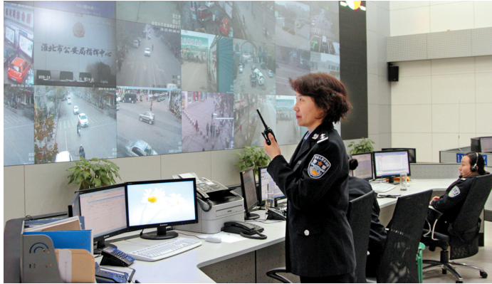
市公安局110指挥中心