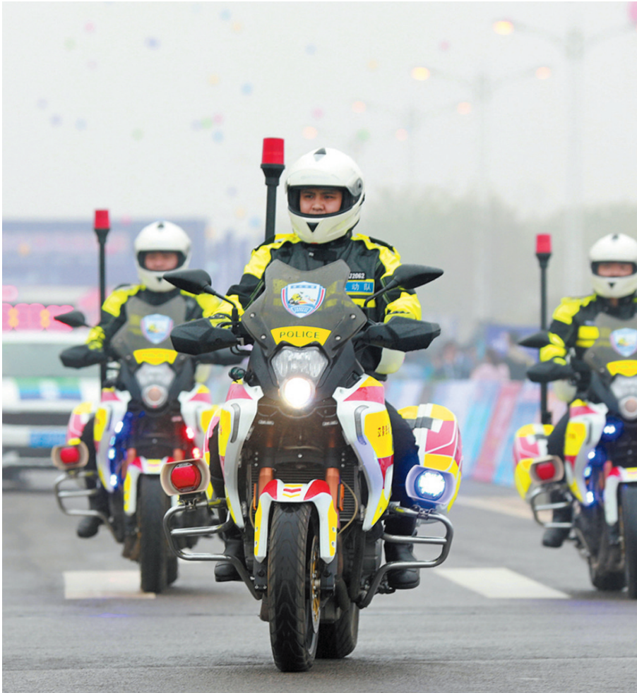
市公安局交警支队护航淮北国际半程马拉松。