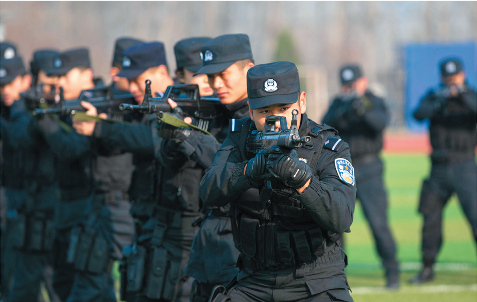
市公安局特警支队“冬训”练兵。