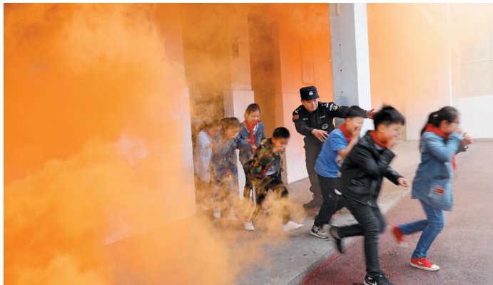
开展反恐演练，建设平安校园。

近年来，我市认真贯彻落实中央精神和省委、省政府有关决策部署，紧紧围绕中国碳谷·绿金淮北战略和“一二三四五”总体发展思路，紧盯“皖北最稳定城市、全省最稳定的城市之一”目标，坚持源头治理，以网格化管理、社会化服务为方向，以保障和改善民生为宗旨，着力提升社会治理效能和公共服务水平。深入开展扫黑除恶专项斗争，创新“一组一会”社会治理，扎实推进“雪亮工程”建设，社会治理基层基础进一步夯实，科学化、法治化水平持续提升，人民群众安全感、满意度持续增强，为淮北加快高质量转型发展创造了和谐稳定的社会环境。