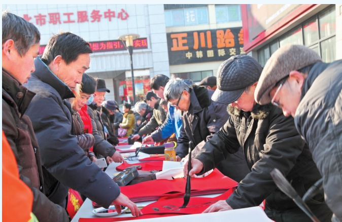
“五送”之“送万福 进万家”活动。