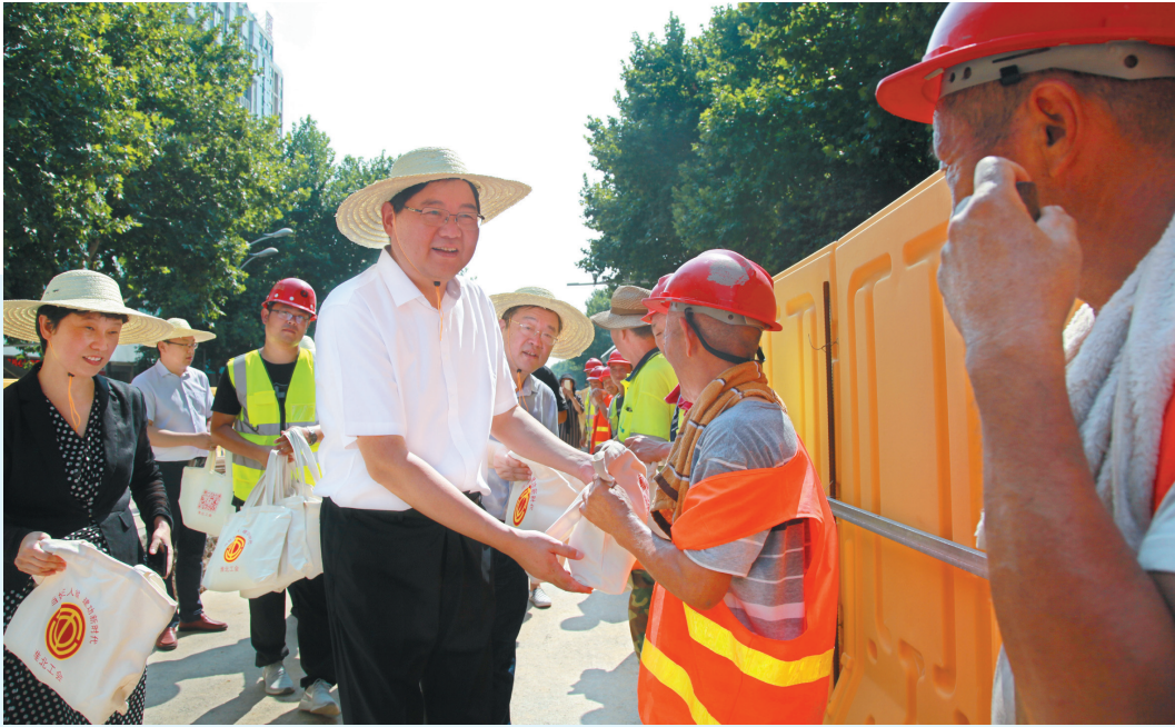
开展为一线职工送清凉活动。(资料图片)