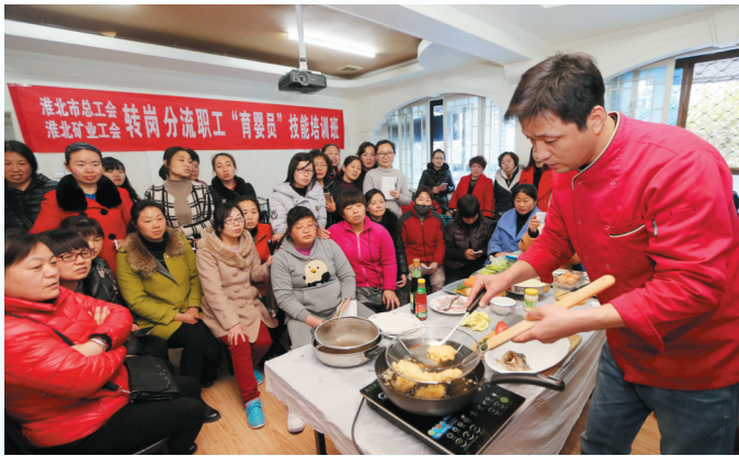
煤矿转岗分流职工技能培训现场。