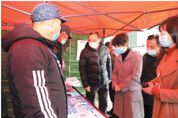
慰问社区抗疫一线人员。(资料图片)

展望未来，任重道远。在百舸争流、千帆竞发的新时代，市总工会将以新气象、新姿态、新探索、新拼搏，在新时代、新征程中不忘初心、继续前行，干出新作为，推动全市工会工作再上新台阶。