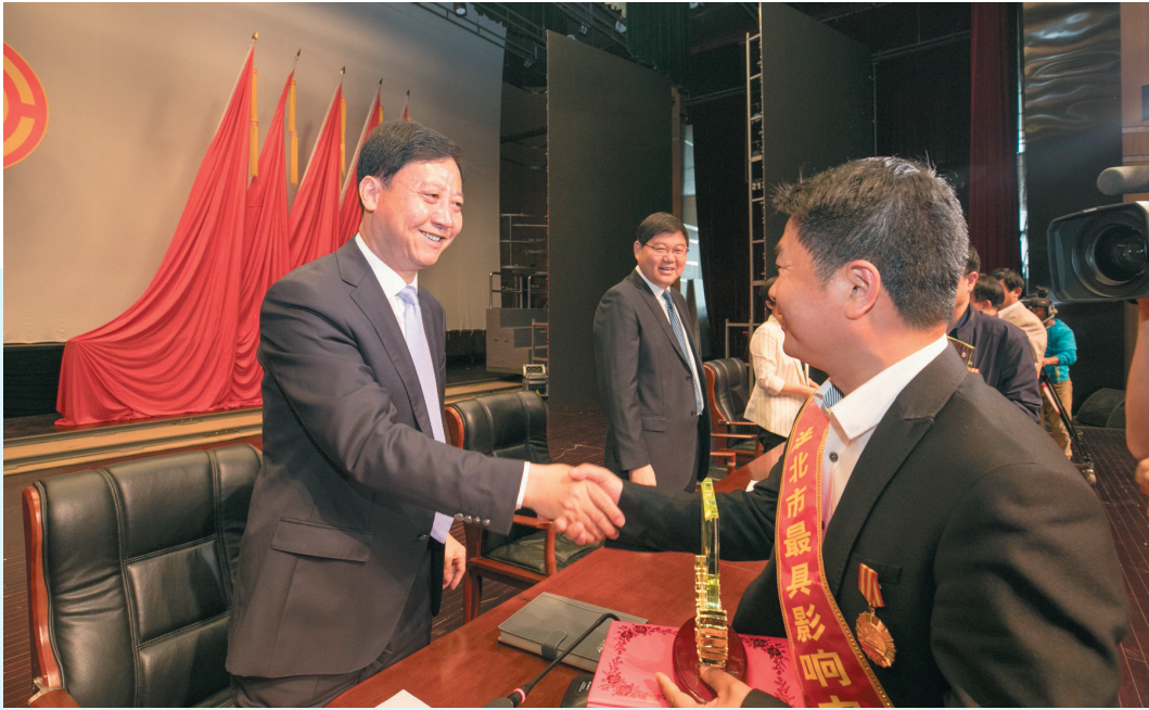
淮北市庆祝五一国际劳动节大会。