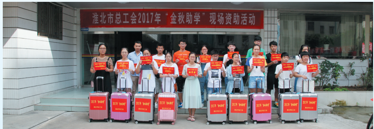
“金秋助学”现场资助活动。(资料图片)