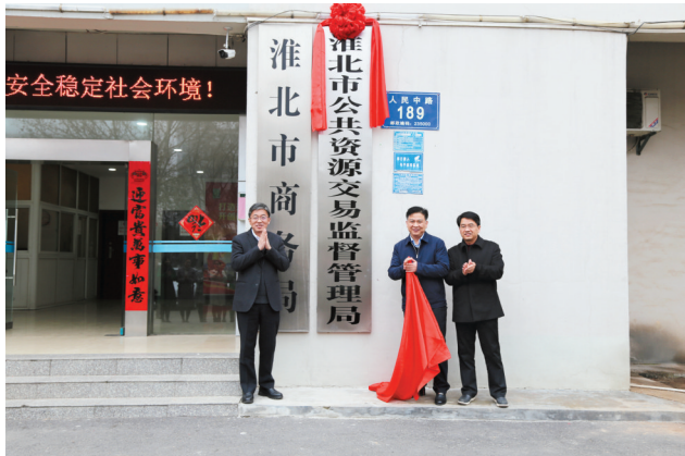
2019年2月,淮北市公共资源交易监督管理局挂牌成立。