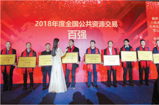
淮北市公共资源交易中心荣获2018年度全国百强单位。

去年以来,市公共资源交易监管局紧紧围绕市委、市政府中心工作,立足我市公共资源交易实际,奔着问题去,迎着困难上,以“维护公平、优化配置、提高效率、防控风险、创新监管、提升服务”为目标,不断完善公共资源交易管理体制,进一步净化公共资源交易市场环境,强化公共资源交易市场监管,维护各方主体合法权益,倾力实现阳光交易,圆满完成了市委、市政府安排的各项工