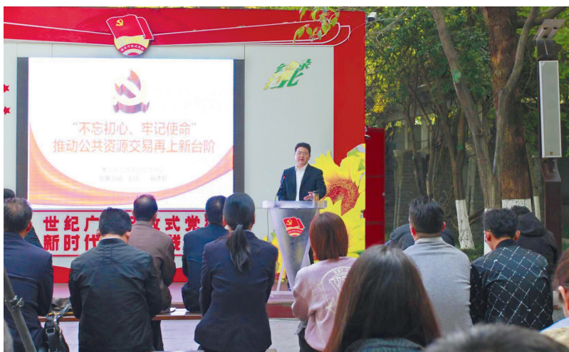
淮北市公共资源交易中心举办“不忘初心、牢记使命”主题教育开放式党课。