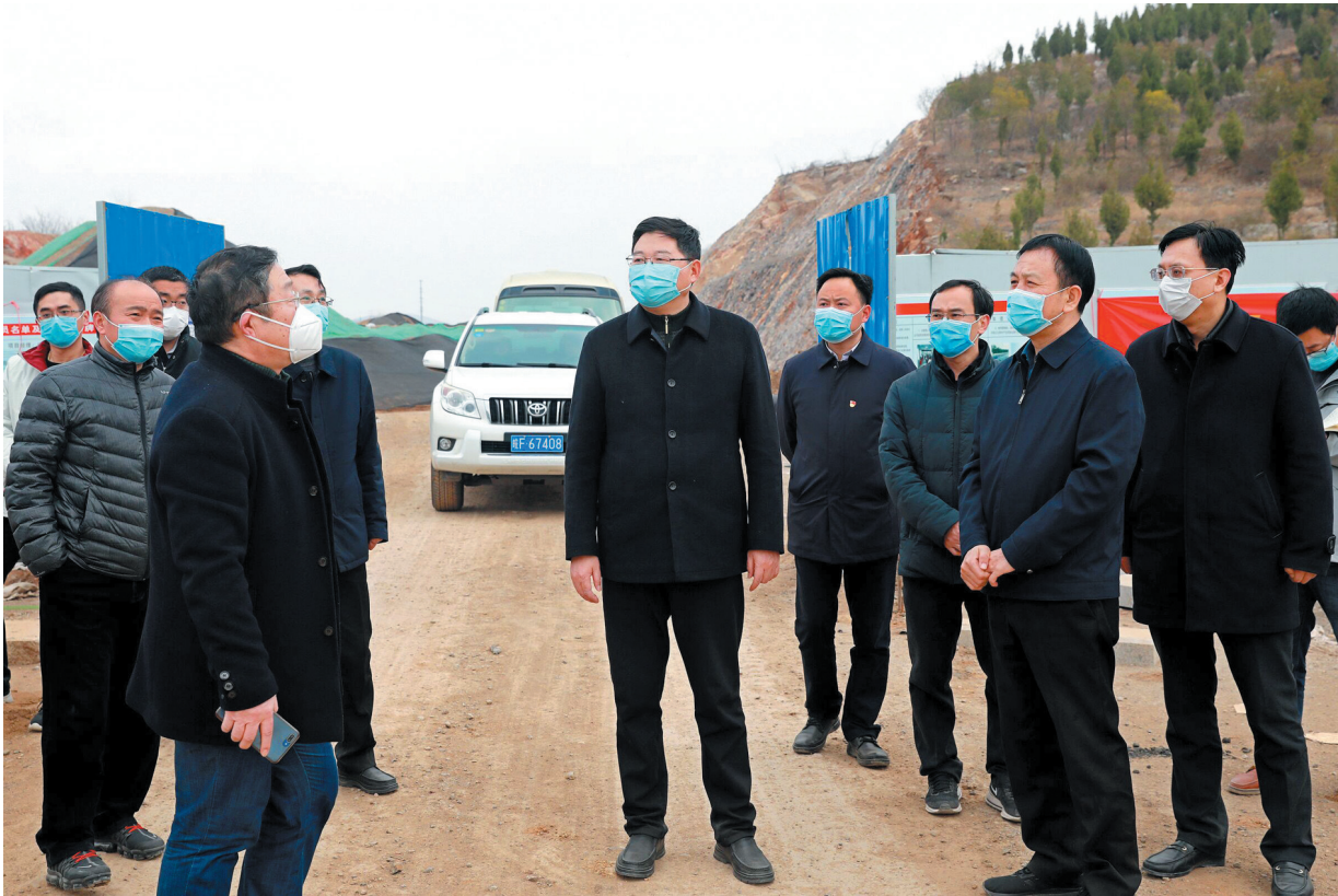
市长戴启远调研重点项目建设。