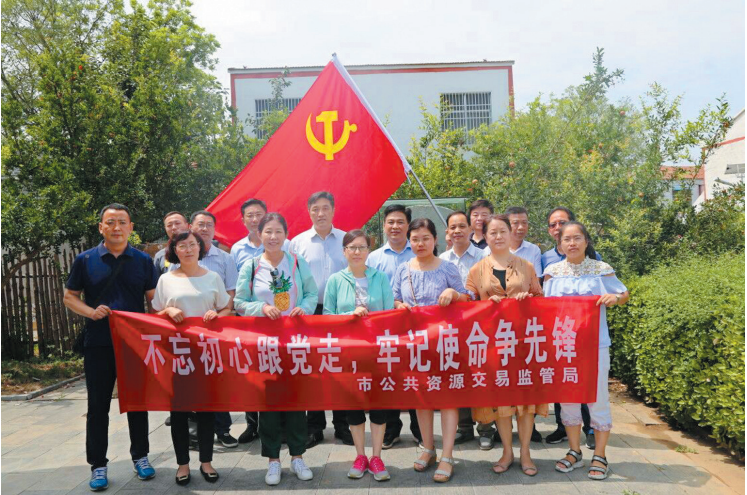
不忘初心跟党走,牢记使命争先锋。

以智慧交易为目标,持续推进交易电子化。开展新旧数据规范替换及数据对接切换工作,优化升级公共资源交易“一张网”平台系统,进一步加强与省公共资源交易监管平台系统的互联互通。创新服务渠道,开通电子交易手机APP,将交易平台向移动客户端拓展延伸,构建了“门户网站+手机移动APP+微信公众号”为主体构架的网上办事大厅,推动“互联网+交易服务”向智慧交易服务提档升级,更大程度实现让数据多跑路、让群众少跑腿。