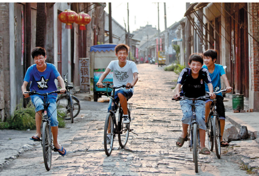
濉溪老街