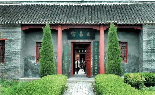
文昌宫一角(资料图)

而今,新时代,新的历史方位,带着镌刻千年的历史印记,流淌至今的进取基因,淮北人民奔着美好生活,一往无前。