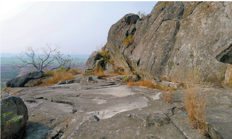
石山孜遗址