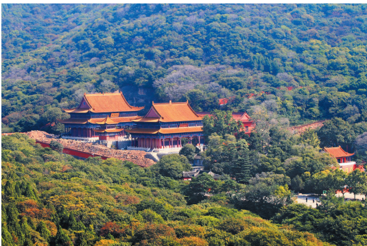
相山公园显通寺