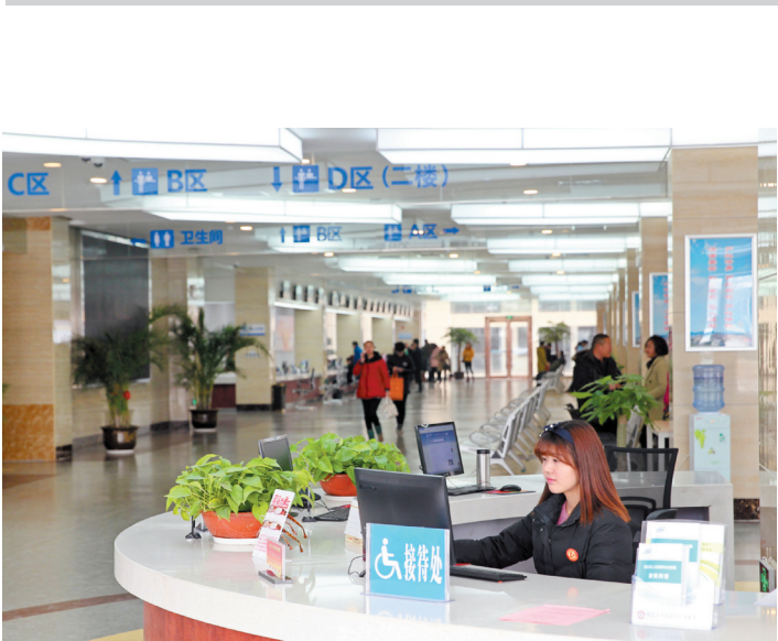
打造精品政务服务中心。