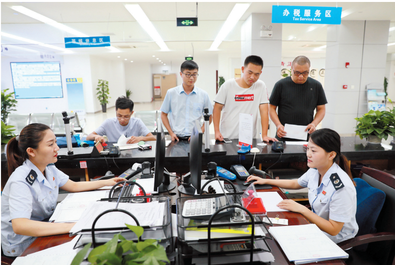
税务合并后的濉溪县办税服务大厅。

我市还建设了公共资源交易中心和信访接待中心。公共资源交易中心成立以来已累计完成各类交易项目近千宗。信访接待中心将信访工作由间接处理、督查督办变为现场解决问题,推动信访工作范围全覆盖、信访形式全覆盖、信访业务全覆盖、处理过程全公开,形成了条块结合、以块为主,多方联动、协调有序,责任明晰、运行高效的工作机制。