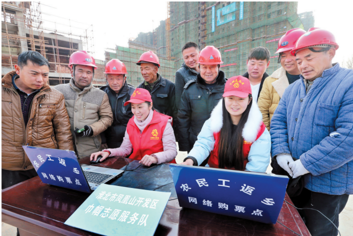
助农民工网络订票。