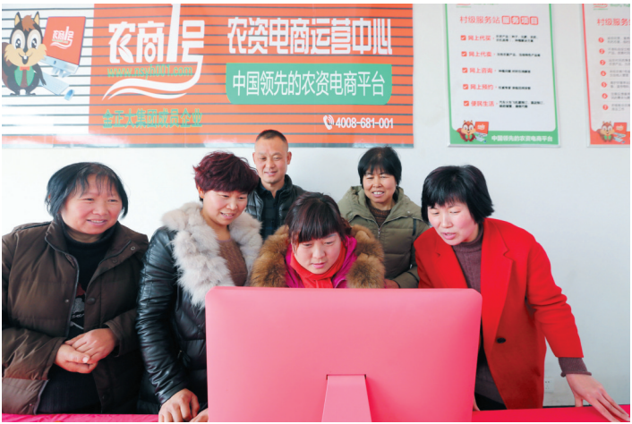
“电子商务”服务乡村百姓。