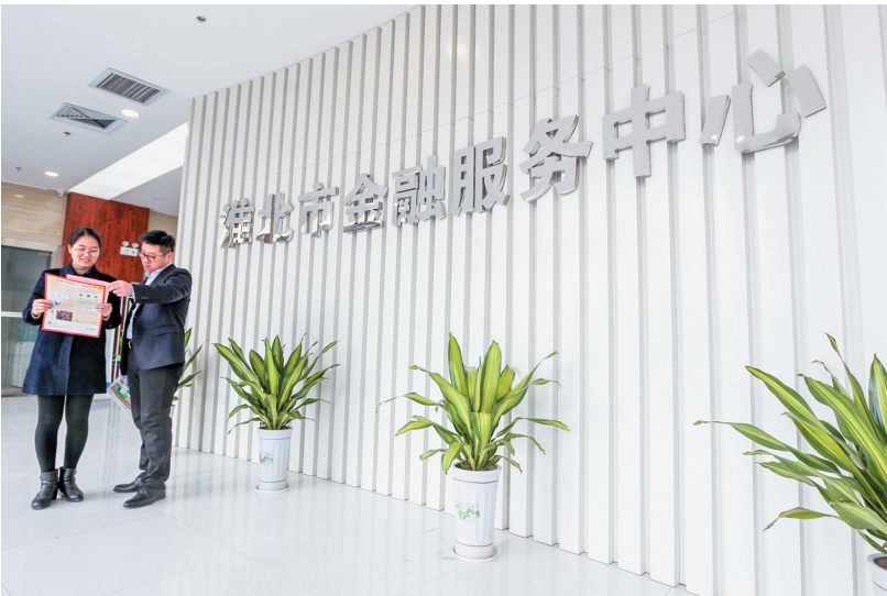
淮北市金融服务中心