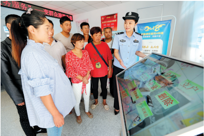
公安“互联网+政务服务”开启便民加速度。