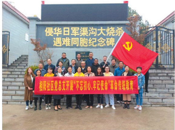
相阳社区党总支开展“不忘初心、牢记使命”革命传统教育。