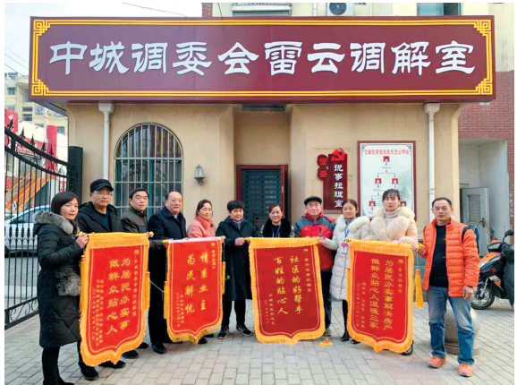
中城调委会“雷云说事拉理室”帮助居民调解三角债经济纠纷。