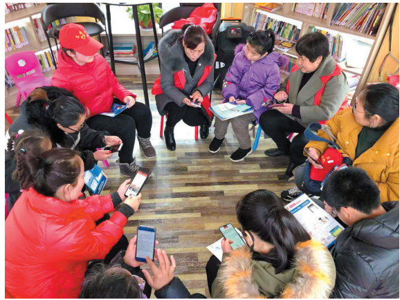
中城社区在华松时代小区“来读书吧”与居民家长和孩子一起参加“学习强国”。