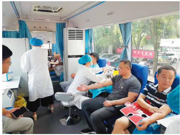
黎苑社区党员志愿者义务献血活动