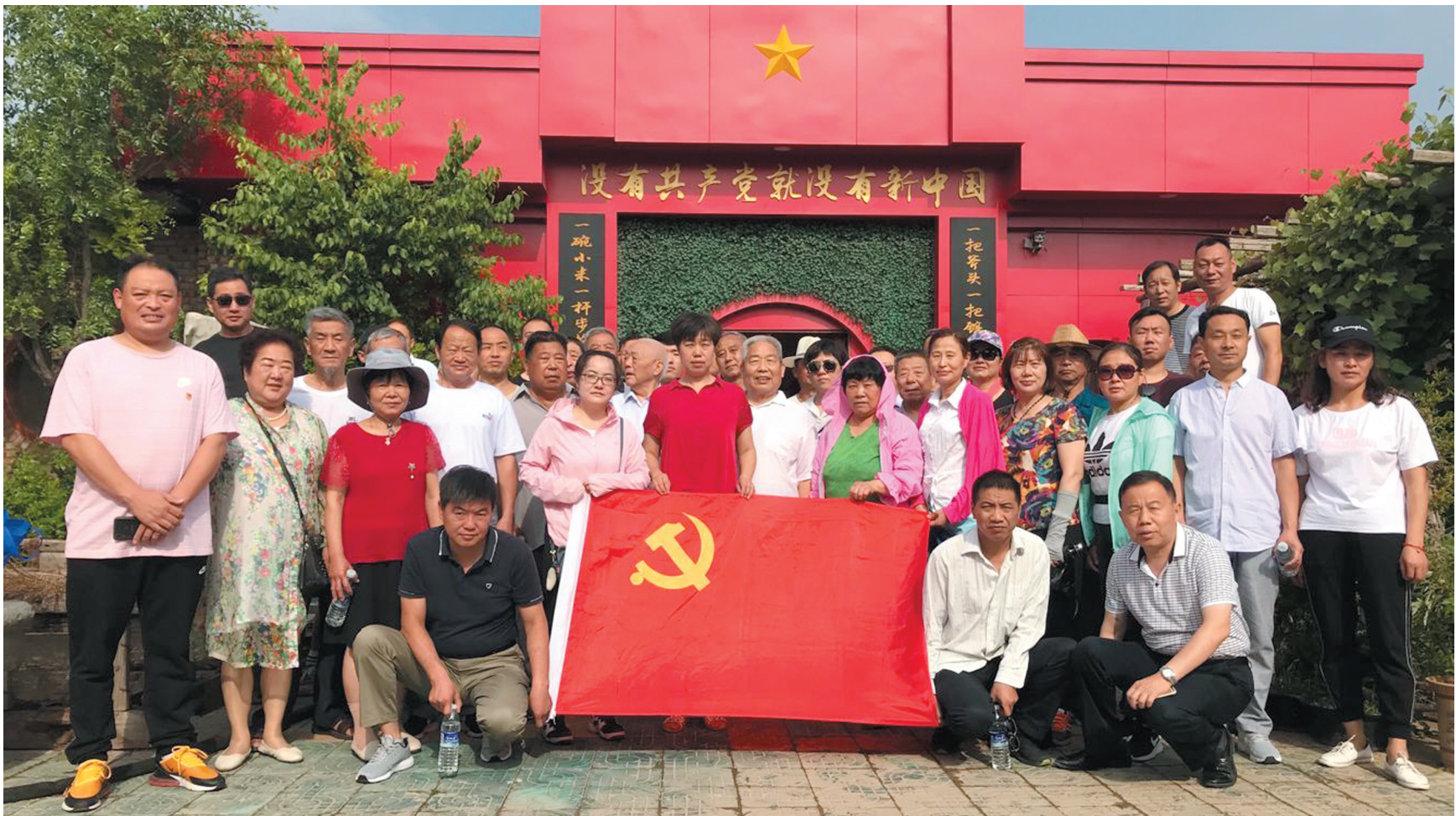
海宫社区在职党员参加党建活动。