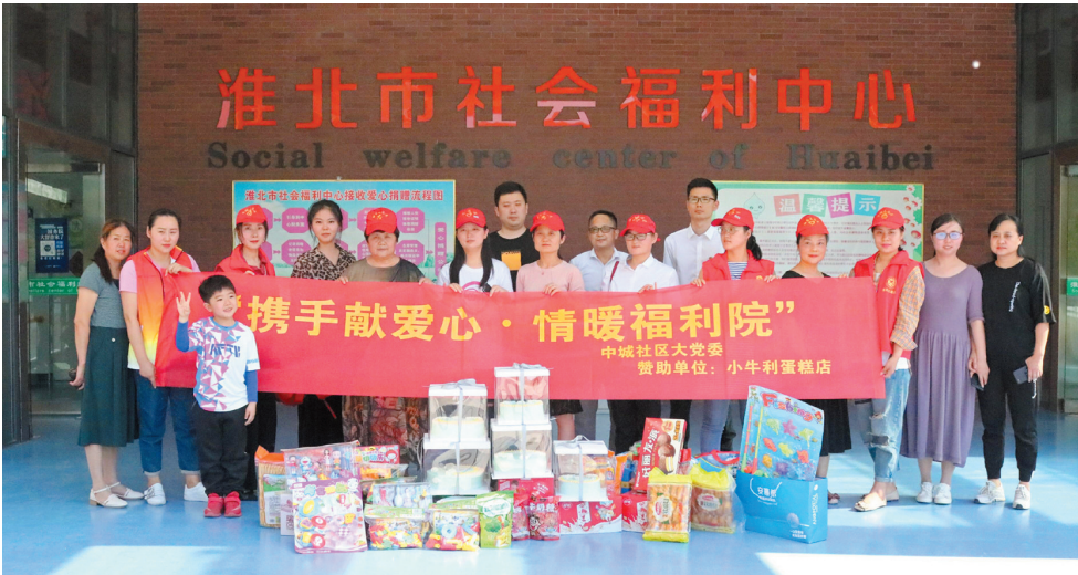
2019年5月23日,中城社区大党委组织志愿者及爱心人士来到淮北市社会福利院,为他们送去祝福和温暖。

23年,一个人的弱冠、一座街道的新生。一个人的心愿,一群人的志愿。传奇仍在继续,相南街道在创新、协调、绿色、开放、共享发展理念的指引下,一天将比一天更精彩。