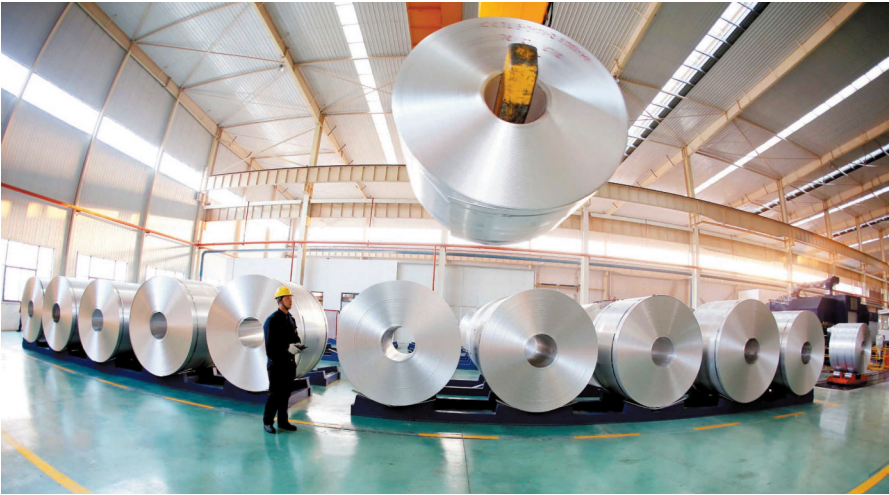
濉溪铝产业发展势头迅猛 ■ 摄影 通讯员 李鑫

“十三五”以来,濉溪县委、县政府扎实开展“一创双加”“双实活动”,大力实施工业强县、创新驱动,完善支持民企发展政策,促进工业经济“强筋壮骨”,胜利实现“皖北当先锋,全省创十强”目标,2019年濉溪经济总量更是提升到全省县城第七位。