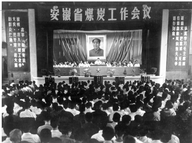
1976年7月4日,安徽省煤炭工作会议在相山召开。