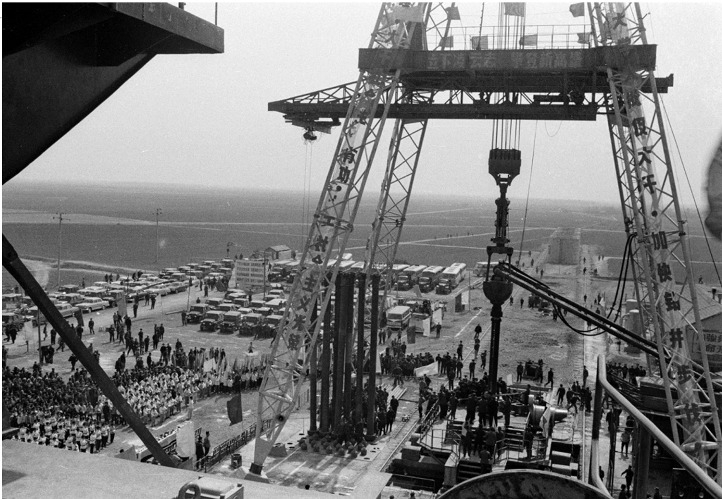
开发新煤田临涣矿。