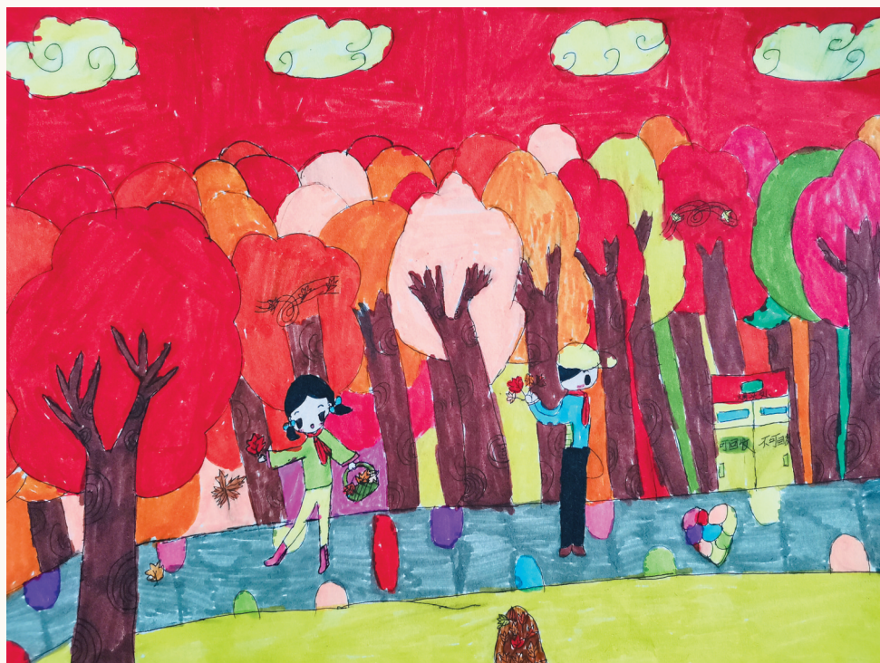
淮海路小学小记者 戚孝男 指导老师:张敏