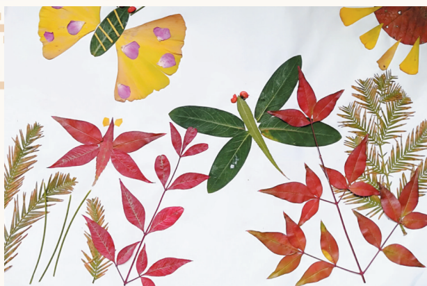
淮海路小学小记者 张馨予 指导老师:丁惠萍