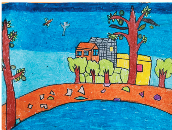
淮海路小学小记者 张紫程 指导老师:张敏