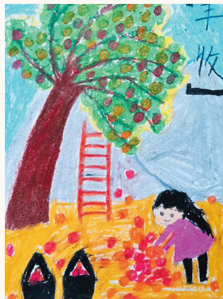
淮海路小学小记者 房夕雅 指导老师:陶丽