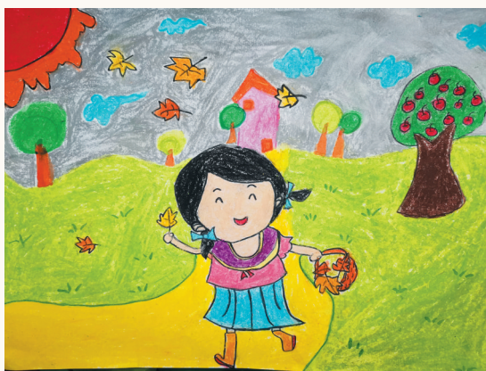
淮海路小学小记者 程小涵 指导老师:张敏