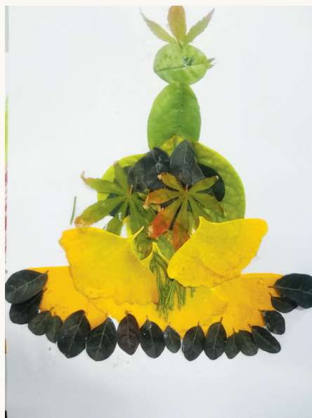
淮海路小学小记者 吴卓睿 指导老师:徐华