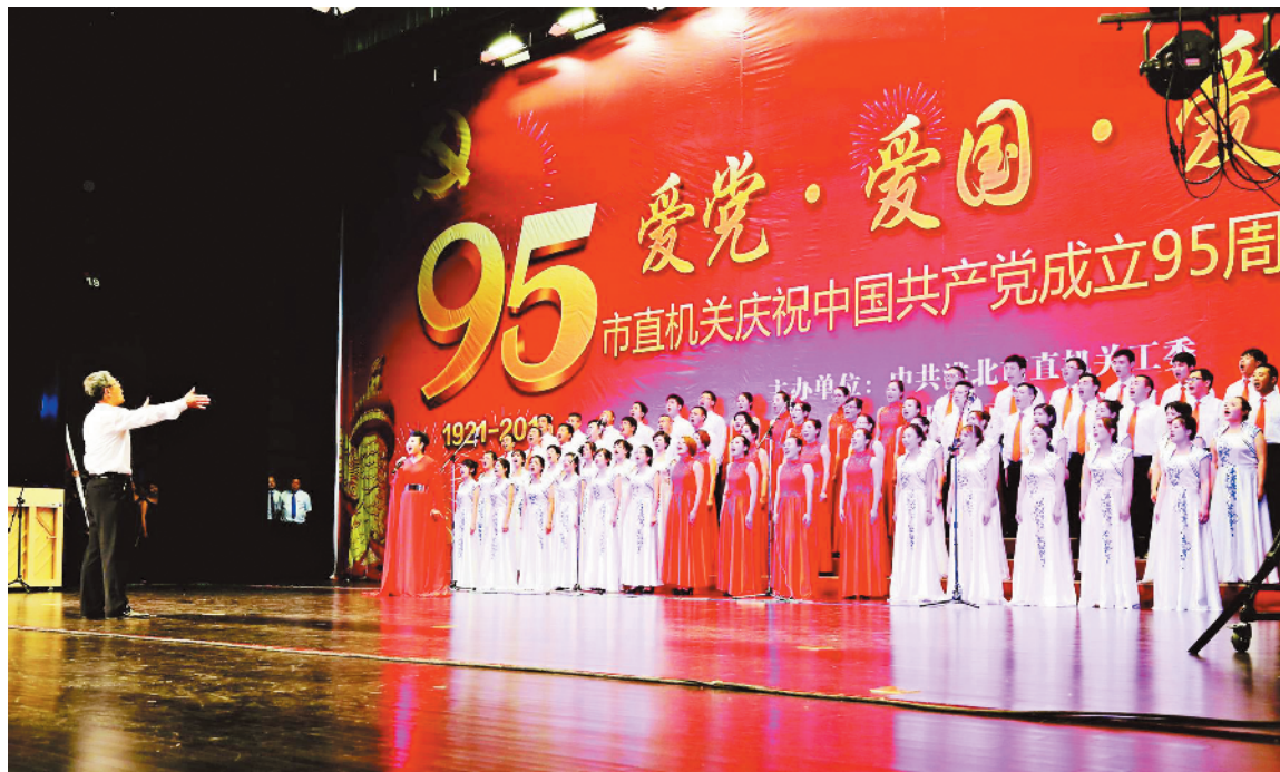
参加庆祝建党歌咏比赛。

——为标准化建设提供资金保障。每年投入50万元党建经费，打造的“干细胞精准扶贫工程”“南湖党建驿站”“微型晨读课”“红色公交”等党建品牌持续推进，其中