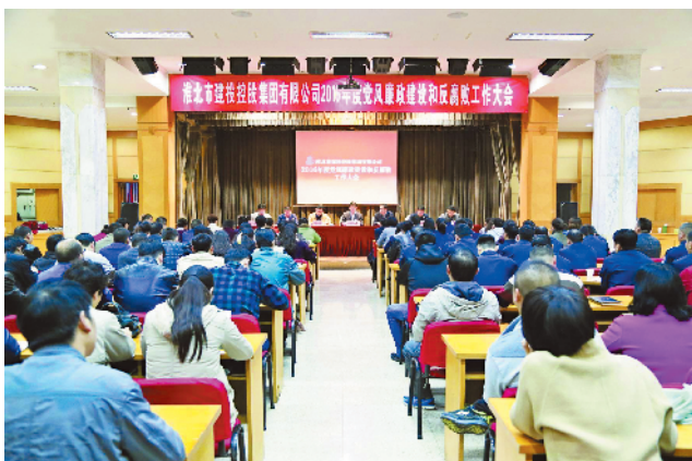
党风廉政建设会议。