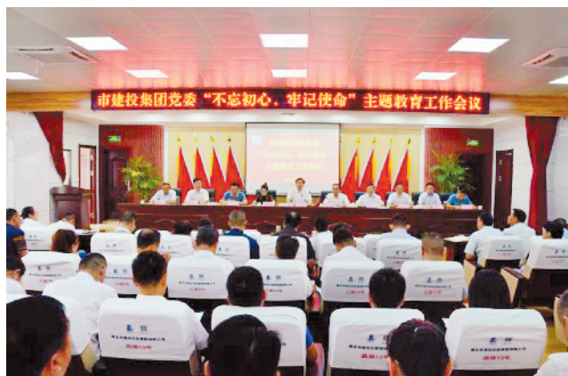
市建投集团党委召开“不忘初心、牢记使命”主题教育工作会议。