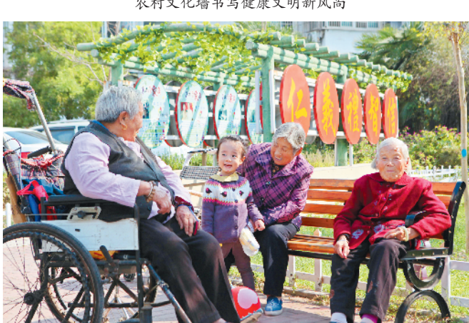
老旧小区改造让居民乐享新生活