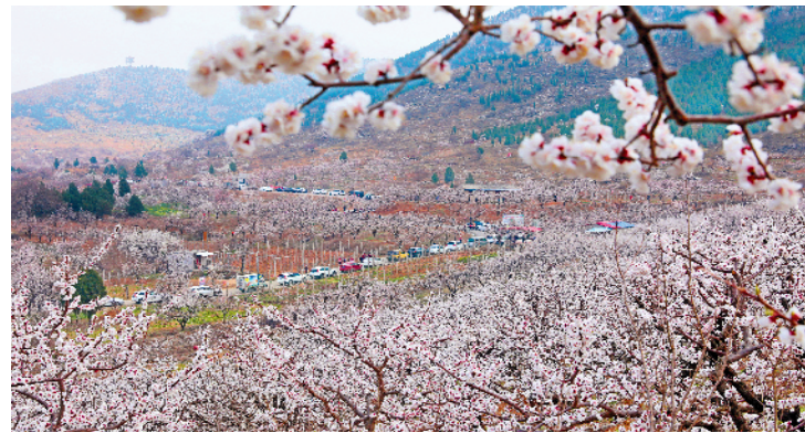
黄里杏花带热乡村旅游