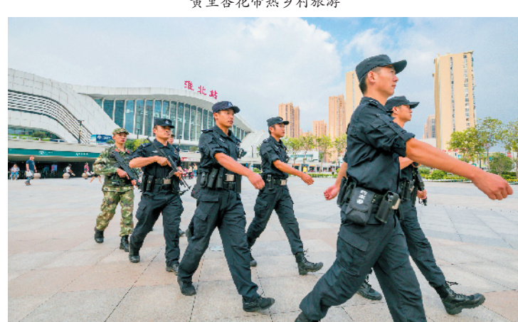
公安特警坚守岗位 营造安定节日氛围