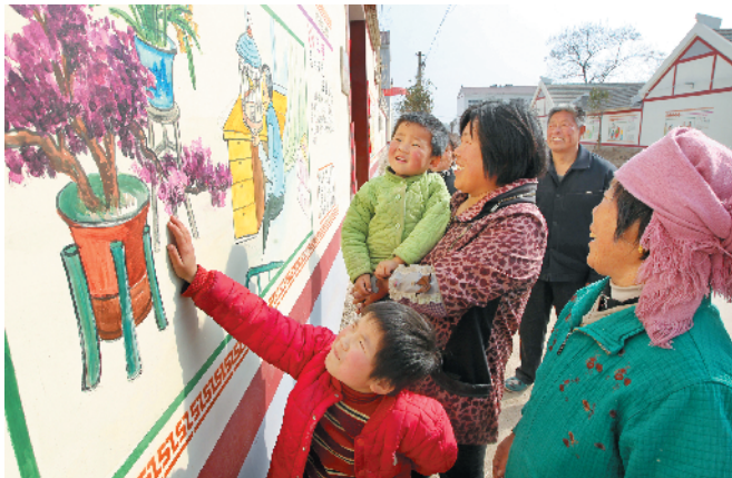
农村文化图书写健康文明新风尚