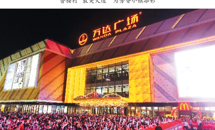
万达广场顺利投入运营