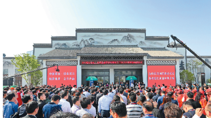
2018淮北食品工业博览会开展现场