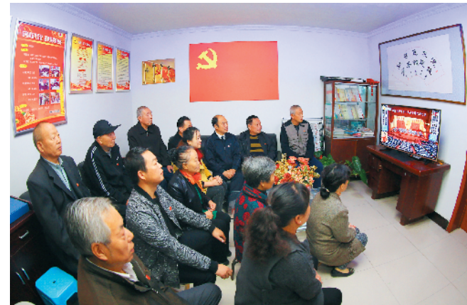
家庭学校凝聚党心