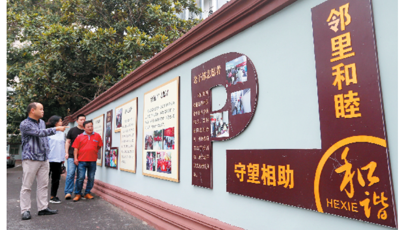
街巷文化“点亮”城市文明