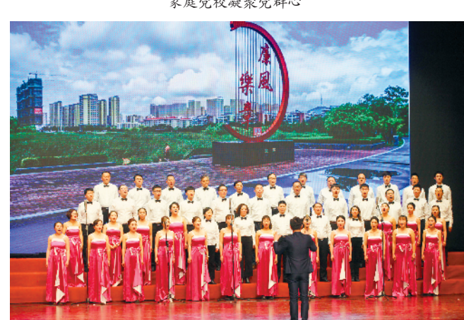
群众文体活动丰富多彩