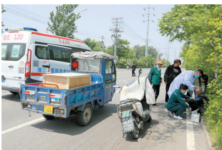
市人民医院急诊护士在烈山区烈山镇宁山村路边，为一名猝倒的老年患者开展救治。