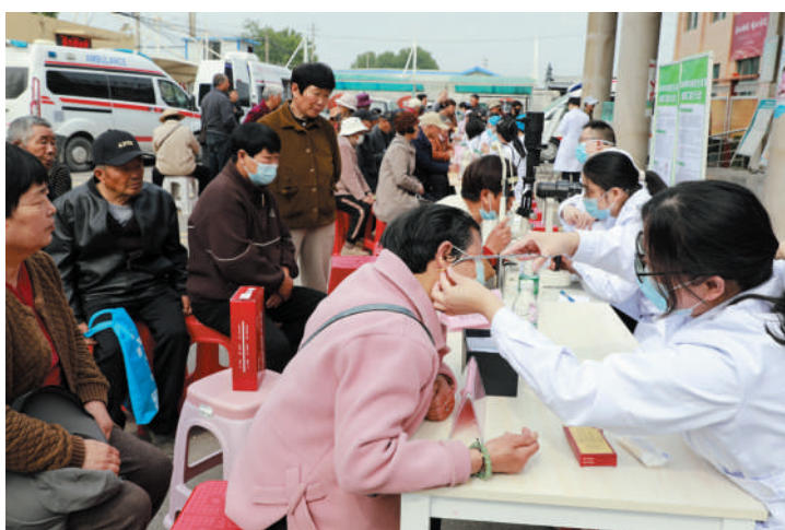
“5·12”国际护士节来临，市人民医院的20多名医务人员来到烈山区宋疃镇马桥大集为村民义诊。