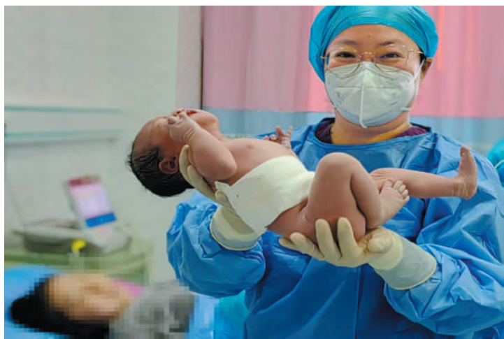
市妇幼保健院助产士托起新分娩的宝宝，母子平安。