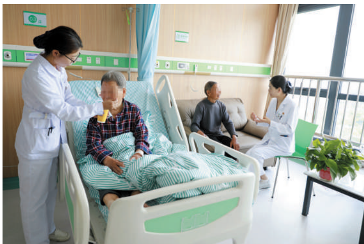
市人民医院特需综合病房内，护士帮助患者进食，并对患者家属开展术后康复训练和生活指导。