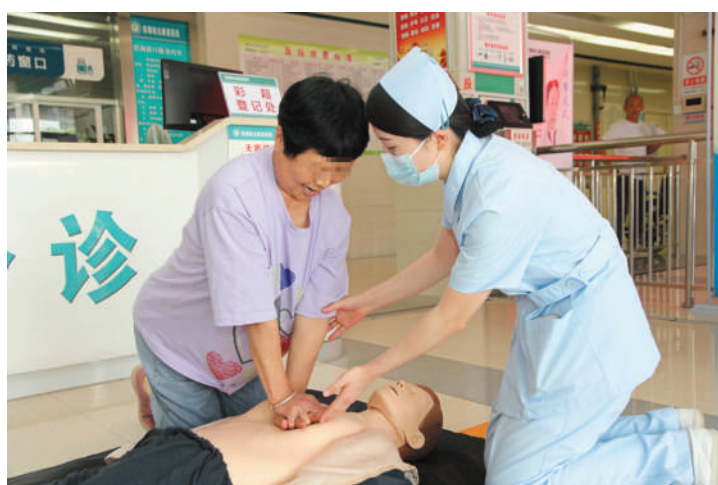
安徽皖北康复医院的护士在为就诊患者普及急救知识。