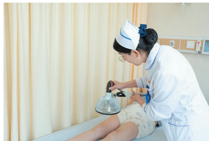
市中医医院康复科护士为脑卒中患者进行平衡针辅助护理。