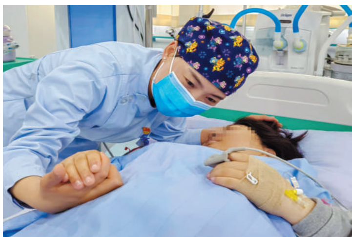
市妇幼保健院监护室护士在安抚高危孕产妇，鼓励自然分娩。