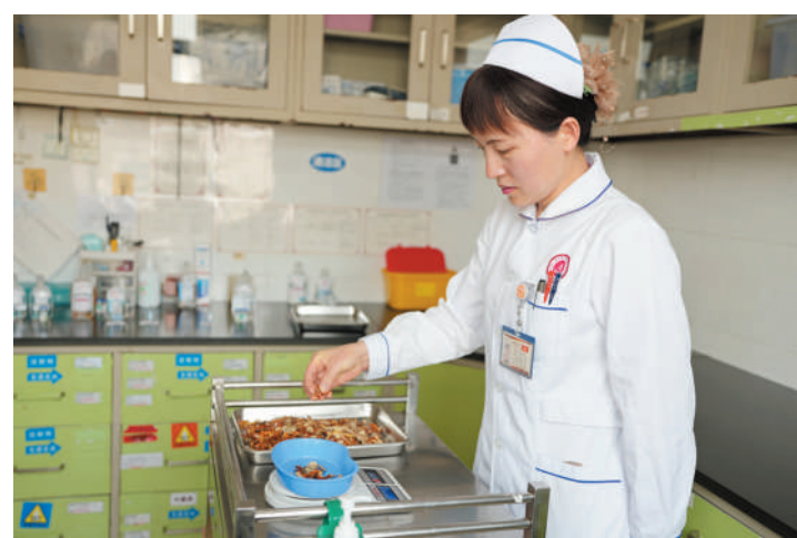
市中医医院护士精准称量药材，为患者进行中药汤剂调配。