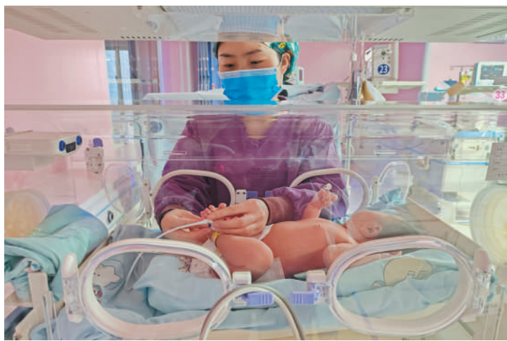
市妇幼保健院新生儿科护士在给新生儿宝宝做血氧监测，严密监测病情。