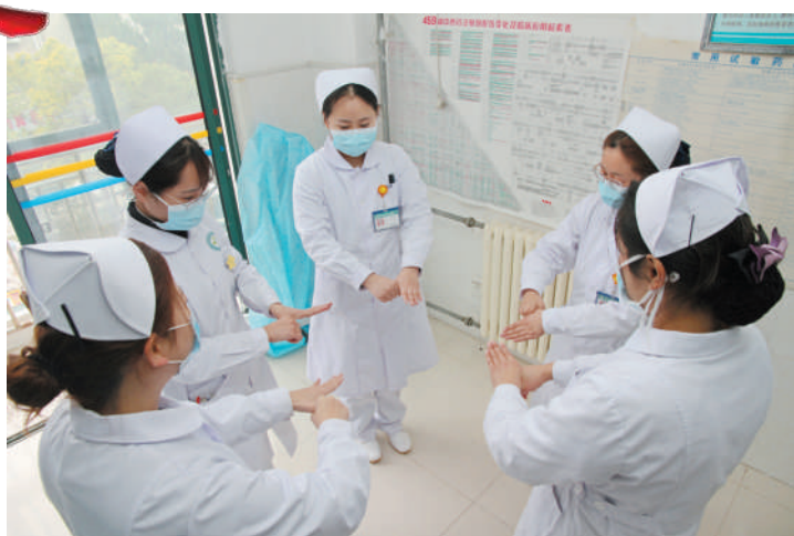
安徽皖北康复医院神经康复科的护士在上岗前进行手消毒。