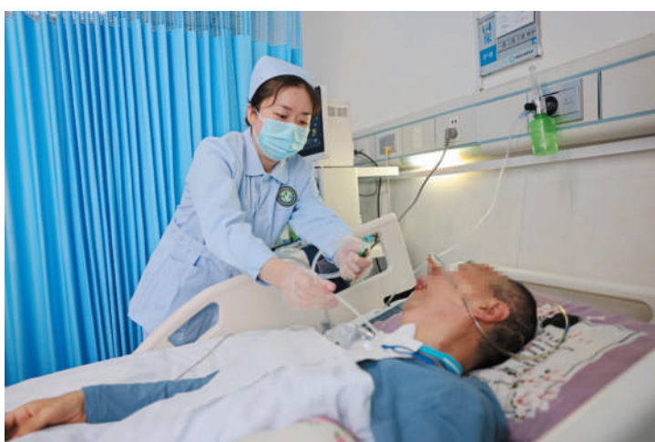
安徽皖北康复医院神经康复科护士在为重症康复患者进行吸痰护理，防止坠积性肺炎发生。