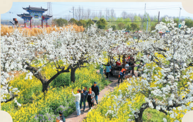
■ 记者 于晓

一场突如其来的春雨，洗去尘埃，也带走了满树琼英。洁白的梨花，簌簌而落，化作香雪，融入春泥。为期近半个月的梨花盛景，在烈山区宋疃镇的和村，算是暂告一个段落。