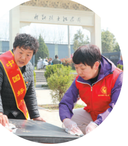
3月27日，清明将至，淮溪县四铺镇新庄烈士纪念馆庄严肃穆，社会各界人士分批在此开展“清明祭英烈”活动。纪念碑前，参加人员整齐列队，通过敬献花篮、肃立默哀、聆听英雄事迹和祭扫烈士墓等方式，深切缅怀革命先烈的丰功伟绩，表达对革命先烈的崇高敬意和深切追思。