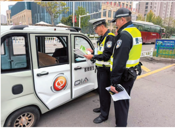
执勤民警对过往的非标电动四轮车进行严格检查。

原则，向驾驶人详细阐明其违法事实、法律依据及潜在危害，并再次发放宣传单页，引导其树立牢固的守法意识和安全观念。