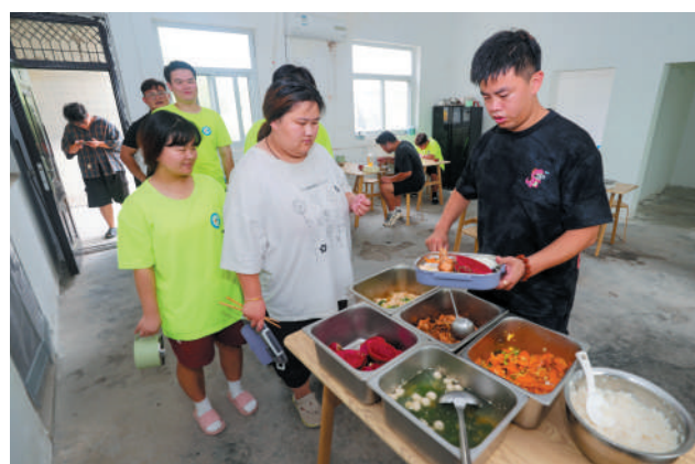
科学膳食,保证营养。