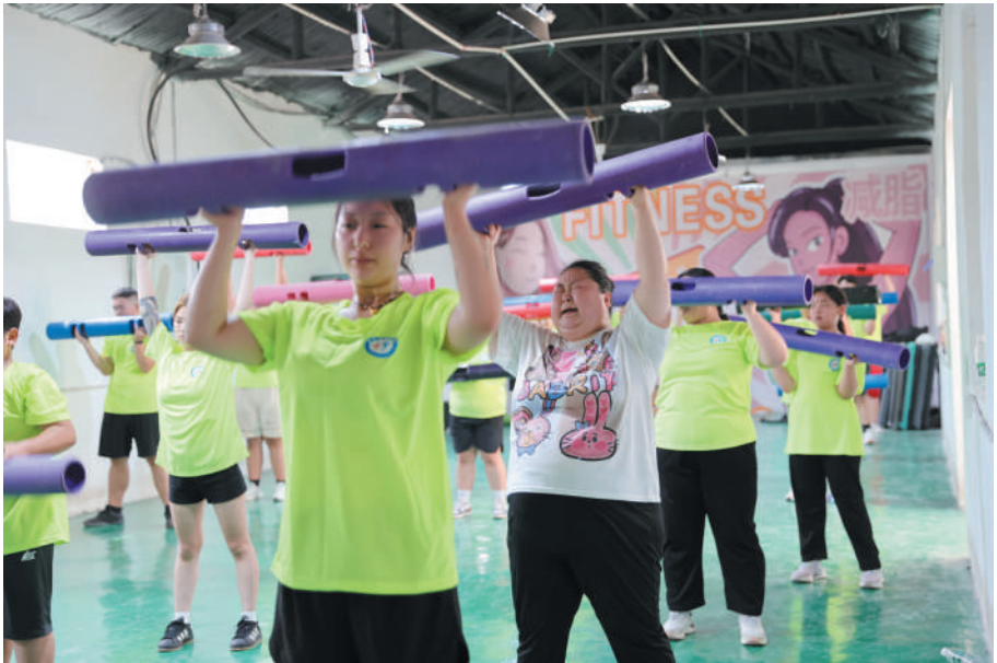
弹力带训练,增强耐力。