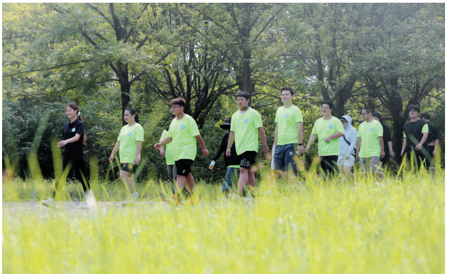
户外拉练,磨炼意志。