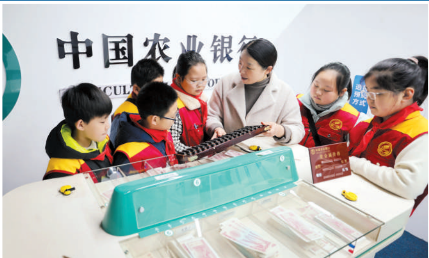
老师在给学生们讲解理财知识。