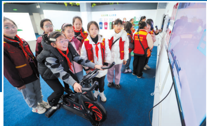
同学们体验安全骑行的快乐。