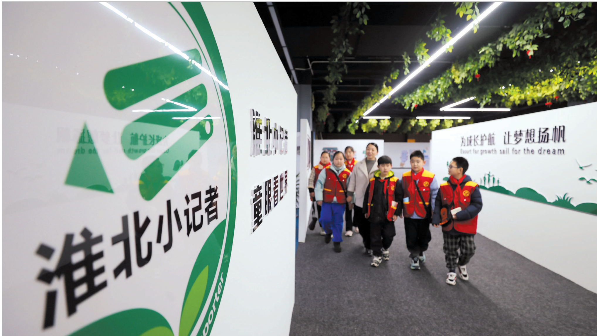
淮北市中小学素质教育中心为孩子们提供丰富多彩的研学体验。