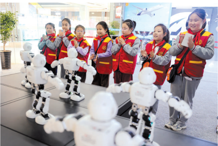
观看AI智能机器人表演。

该中心为综合性教育场馆,位于龙溪奥莱广场,由淮北市传媒中心尚学教育公司投资建设,面积约1500平方米,已建成C919大飞机、火箭发射塔、AI智能机器人、仿真医院、小银行、小邮局、模拟报警、安全骑行等16个体验场馆,旨在培养广