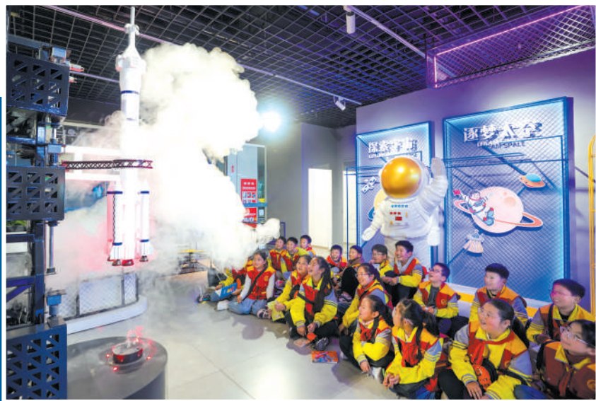
近距离体验火箭的发射过程。