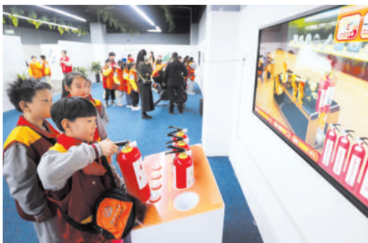
亲自操作,了解灭火装备的使用方法。