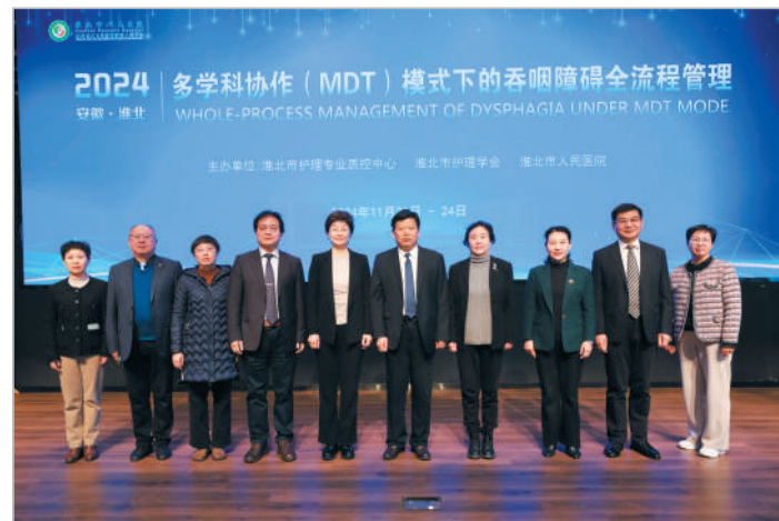
市人民医院举办国家级继教项目多学科协作(MDT)模式下的吞咽障碍全流程管理培训班。