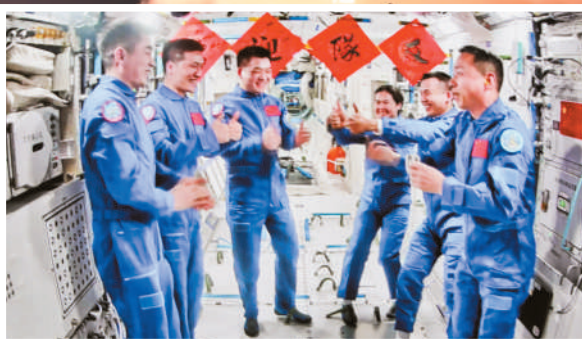
10月30日在北京航天飞行控制中心拍摄的神舟十九号航天员乘组和神舟十八号航天员乘组交流的画面。 ■ 新华社发 摄影 韩启扬