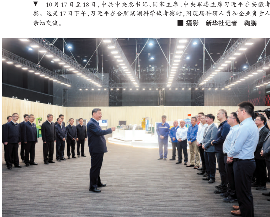
▲ 10月17日至18日，中共中央总书记、国家主席、中央军委主席习近平在安徽考察。这是17日下午，习近平在合肥滨湖科学城察看安徽省重大科技创新成果集中展示。