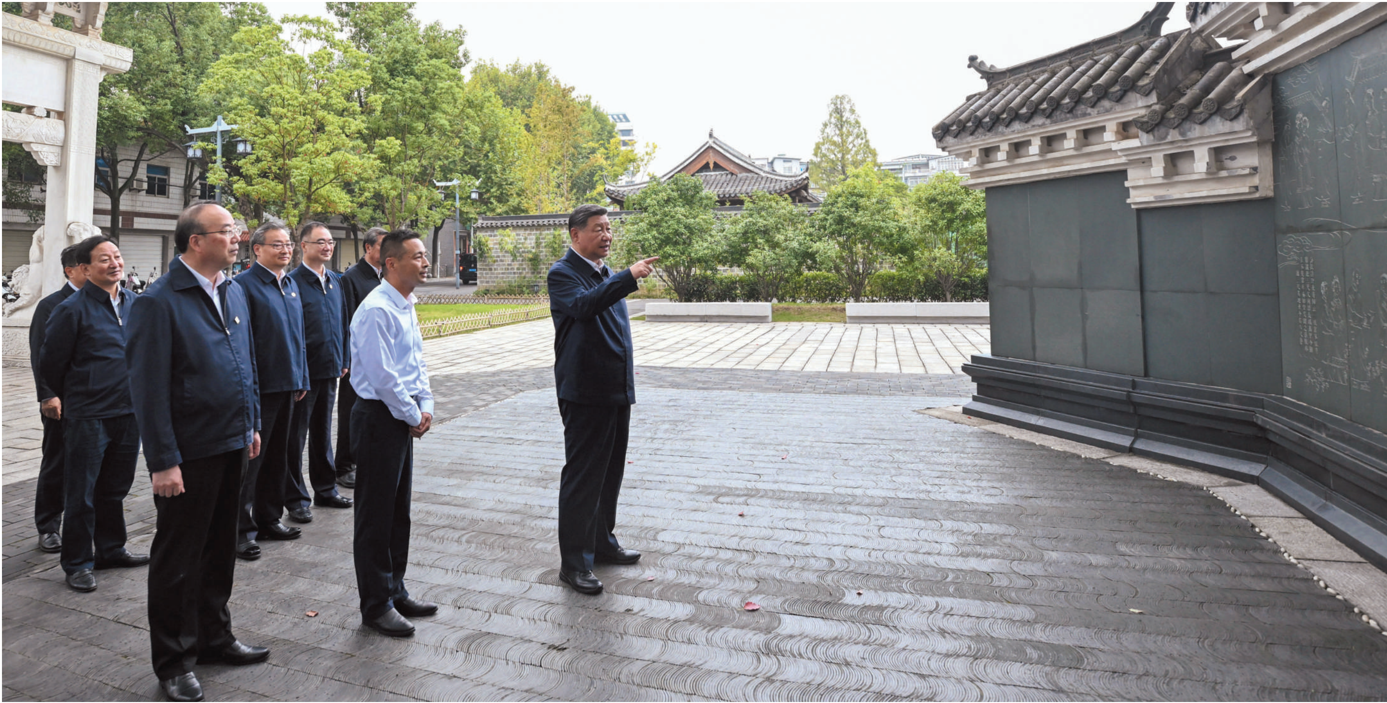
▲ 10月17日至18日，中共中央总书记、国家主席、中央军委主席习近平在安徽考察。这是17日下午，习近平在安庆桐城市六尺巷考察。