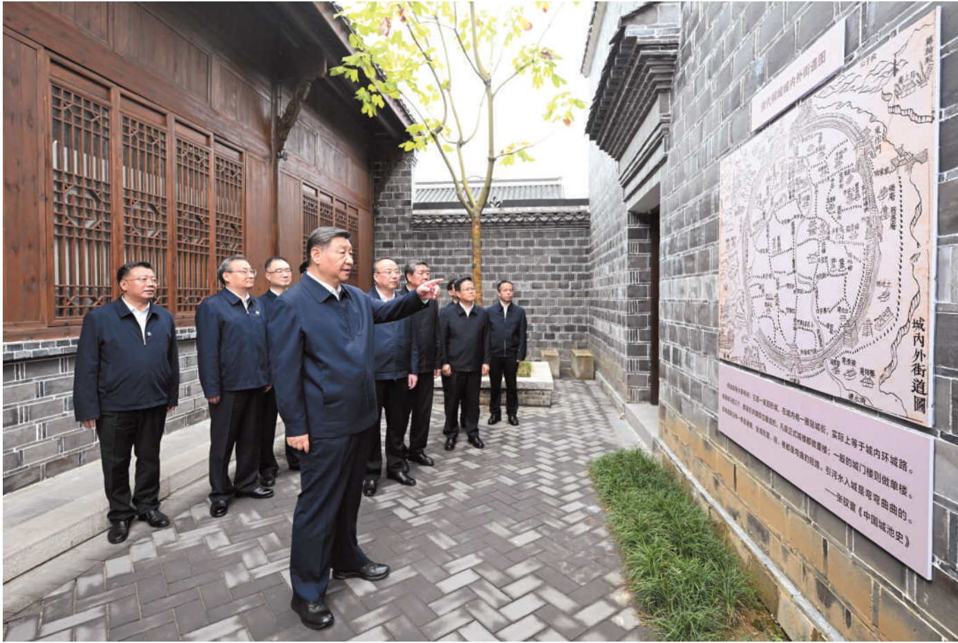
▲ 10月17日至18日，中共中央总书记、国家主席、中央军委主席习近平在安徽考察。这是17日下午，习近平在安庆桐城市六尺巷考察。