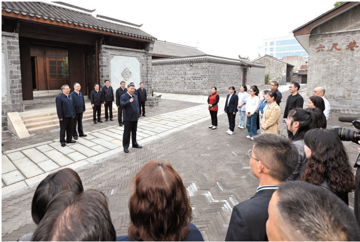
▲ 10月17日至18日，中共中央总书记、国家主席、中央军委主席习近平在安徽考察。这是17日下午，习近平在安庆桐城市六尺巷考察时，同当地居民和游客亲切交流。