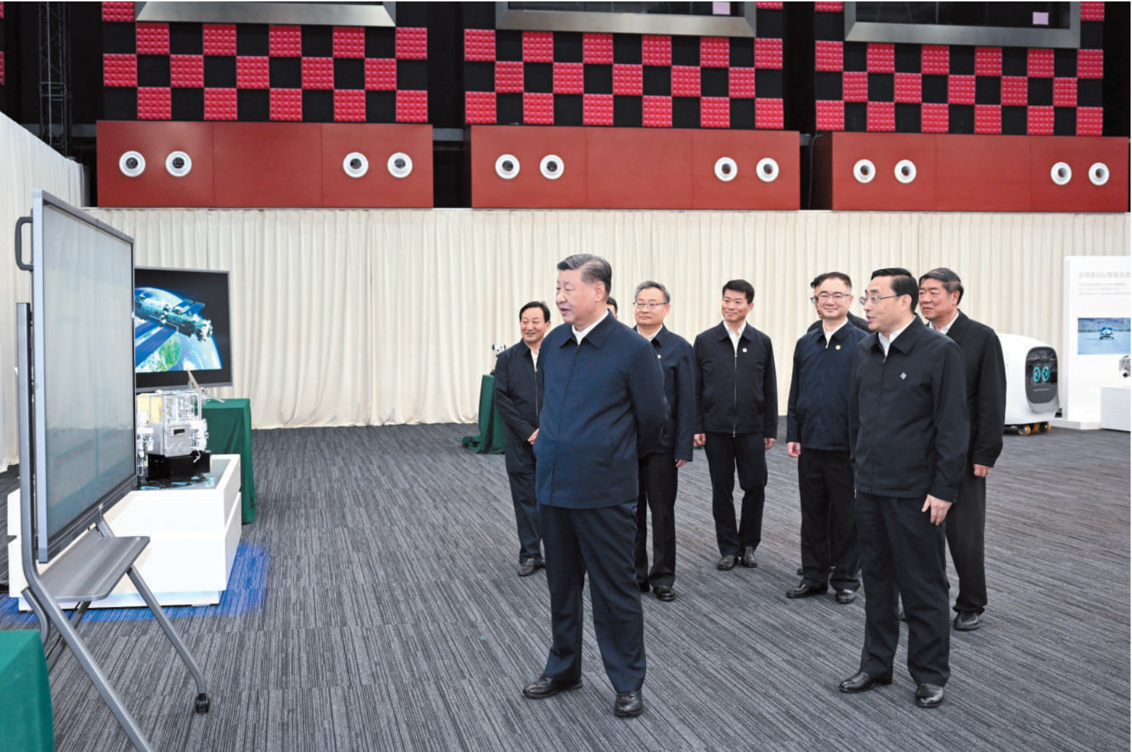
▼ 10月17日至18日，中共中央总书记、国家主席、中央军委主席习近平在安徽考察。这是17日下午，习近平在合肥滨湖科学城察看安徽省重大科技创新成果集中展示。