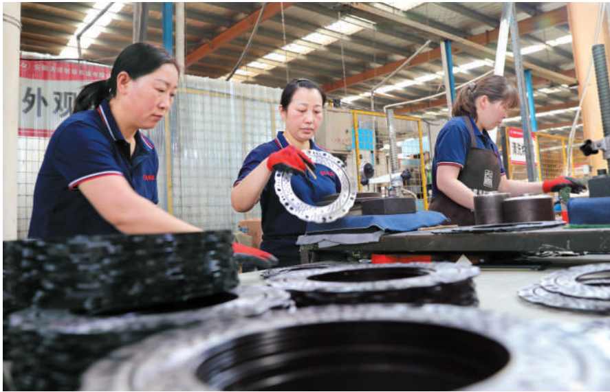
安徽天诺制动系统有限公司的产品,市场份额占全国的30%以上,成为行业龙头企业。

在市、县各级部门和濉溪经开区的大力支持下,企业产值以每年至少30%的速度增长——2022年首破1亿元,2023年实现1.54亿元,预计2024年将突破2亿元。