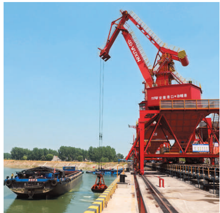
孙疃港是目前淮北地区功能平台最齐全的综合型港口。