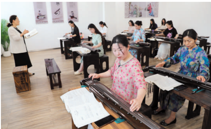
濉溪县文化馆定期举行公益古琴课堂,让高雅艺术走进群众生活。