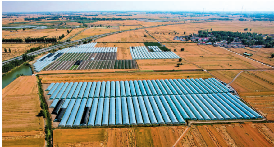
四铺镇梁圩村长三角绿色农产品加工供应基地持续提升蔬菜种植效益,实现从低端品种向高端品种转型升级。