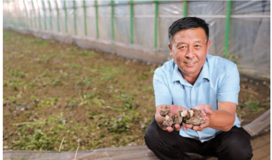
刘桥镇王堰村建强用好白玉蜗牛养殖基地,加快实现强村富民。

走在濉溪大地,广袤的田野一片金黄,设施大棚里果蔬枝繁叶茂、农业示范园硕果累累、圈养的牛羊又肥又壮……多元化的农业项目透着勃勃生机,记者处处感受到乡村振兴的鼓点和活力。