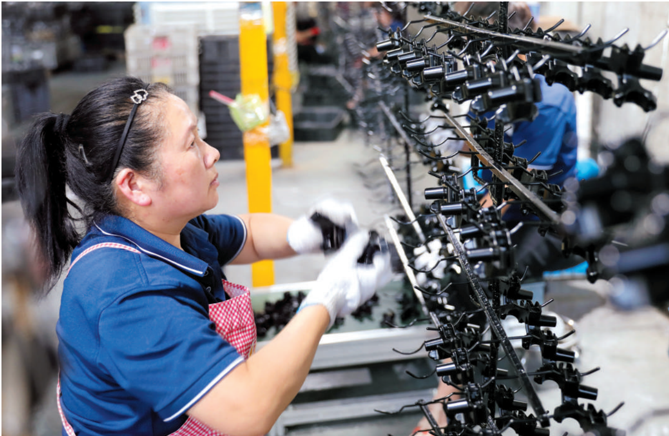
濉溪县持续优化营商环境,助力安徽名开机车部品有限公司等企业茁壮成长。

导牵头的营商环境工作专班,为项目落地提供优质服。设立企业开办、工程建设项目审批服务、不动产交易等专厅,打造“一窗通办”综合窗口,优化“快办”志愿服务,用好涉企服务“绿色通道”,政务服务平均办事时限从3天缩减至1天,“最多跑一次”事项覆盖率100%。