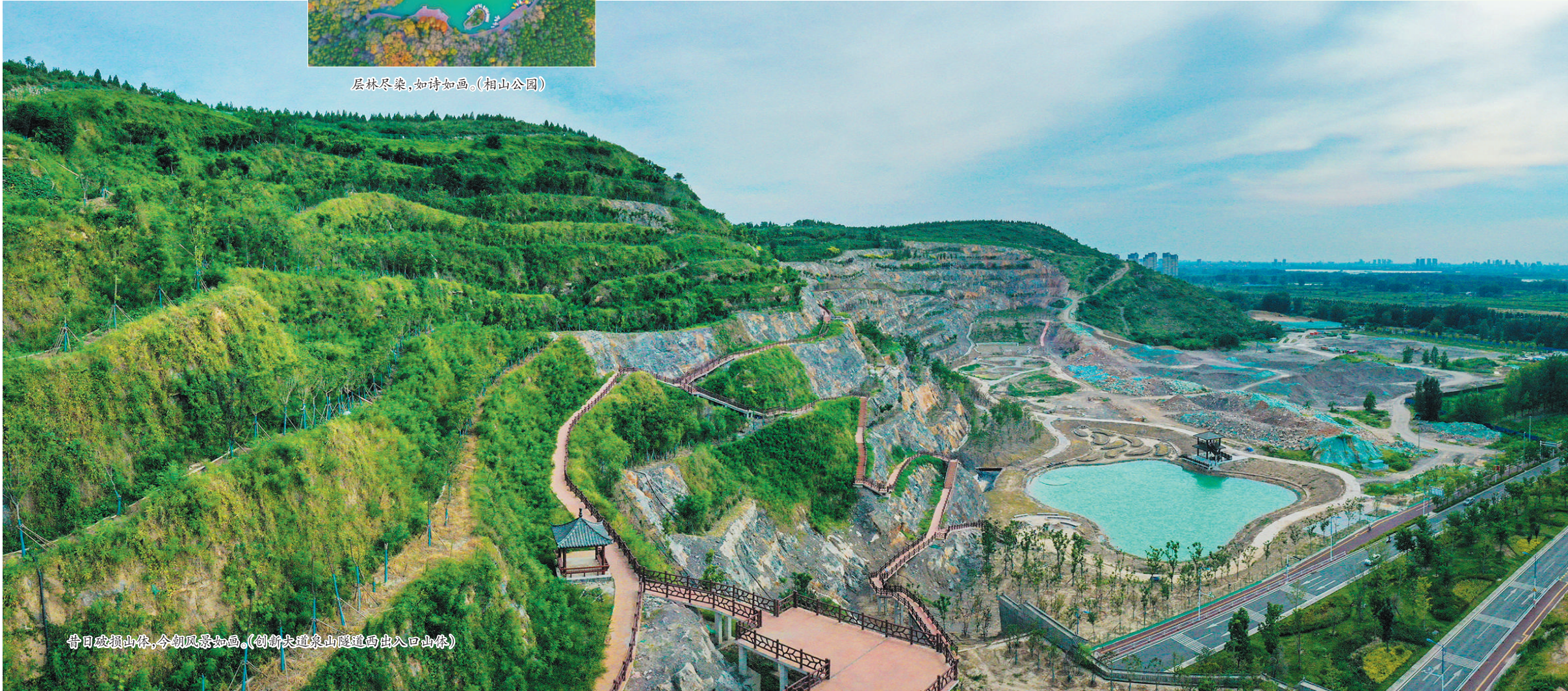
昔日破損山体,今朝風景如畫。(創新大道泉山隧道西出入口山体)