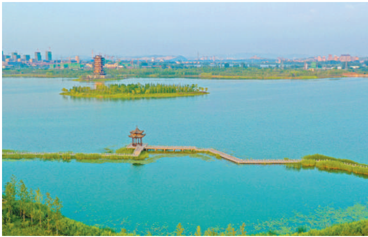
水清岸绿。(乾隆湖风景区)