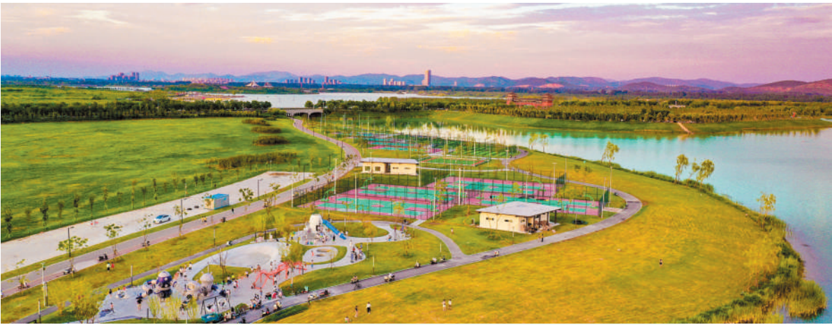
采煤沉陷区变身生态风景区。(绿金湖)