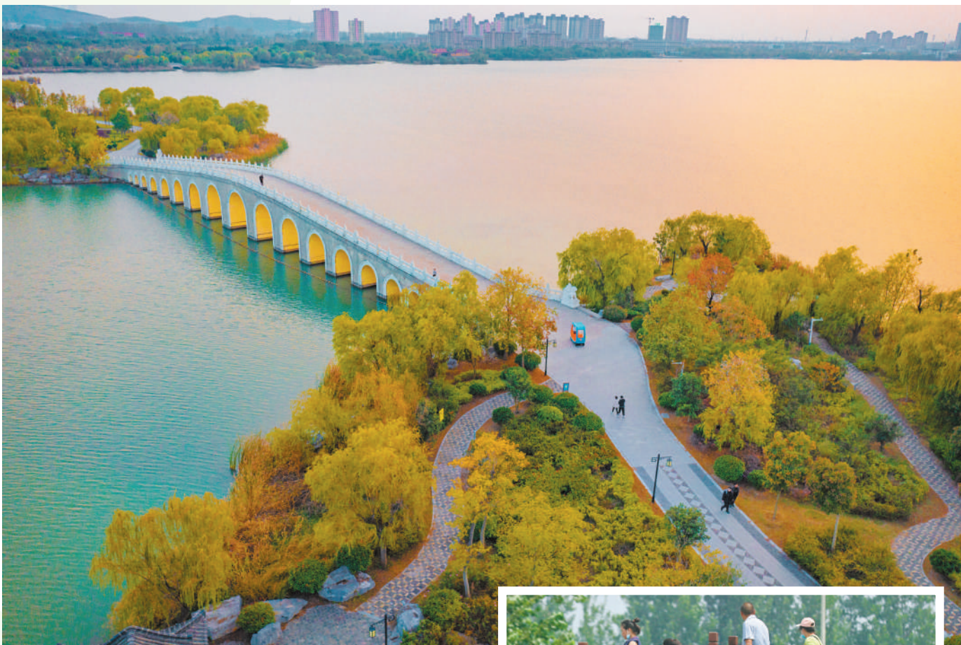
人在景中走,景在心中留。(南湖湿地公园)