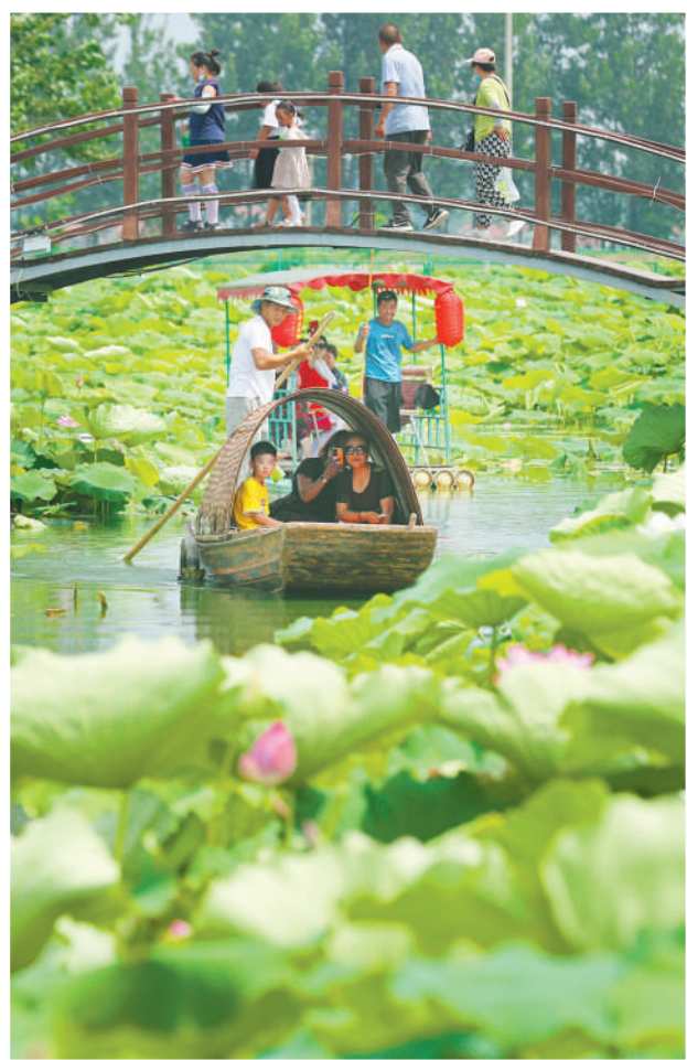
荷塘美景醉游人。(柳江口)