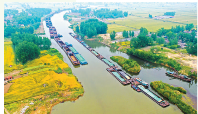
悠悠浍河排商船。(南坪港码头)