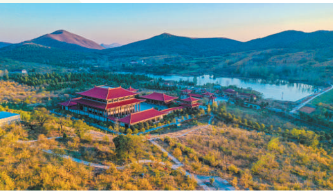
山不在高,有景则美。(四季榴园)