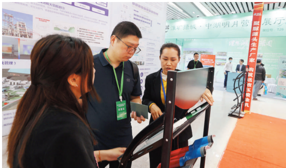
展馆内，客商与展商进行产品供需对接。

惠风和畅，繁花似锦。淮北已然是一片企业家投资兴业、创新创业的热土。“未来，我们将以此次推介会为契机，秉持‘服务项目就是服务发展’的理念，全力为企业提供优质服。也热切希望与各位企业家加深沟通交流，深挖合作潜力，双向奔赴，彼此成就，携手共进、合作共赢。”淮北市副市长姚珂在招商推介会上表示。