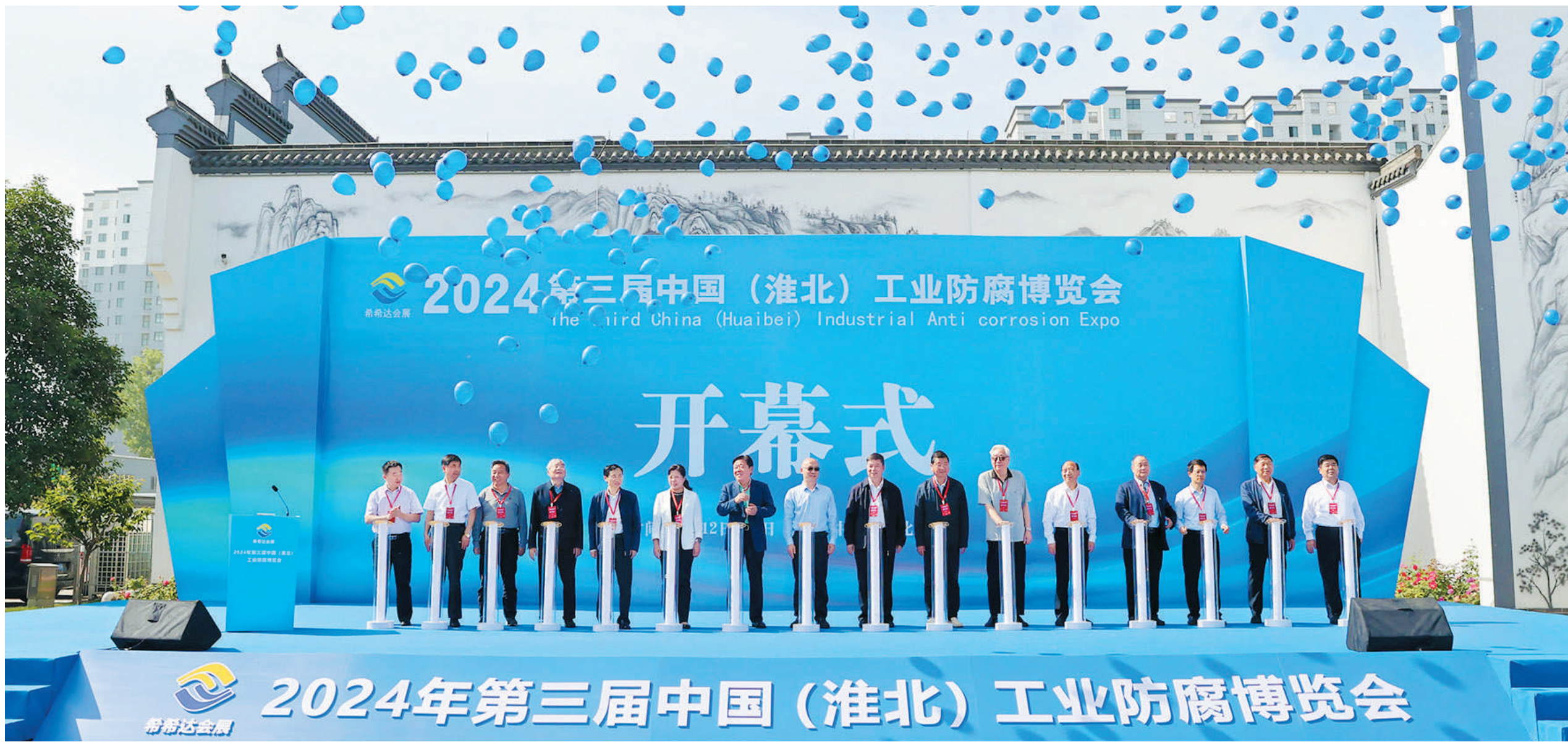
2024年第三届中国(淮北)工业防腐博览会开幕式现场。