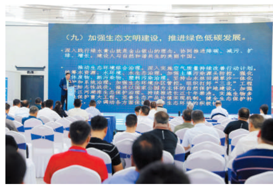
2024中国(淮北)工业防腐控制工程论坛上精彩又专业的主题报告吸引听众。